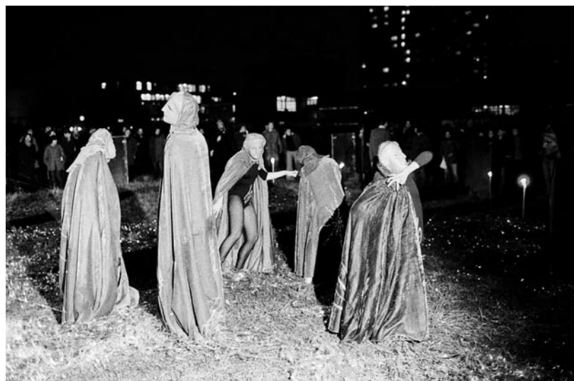
SVIJET MASKI, MEKANI BRODOVI