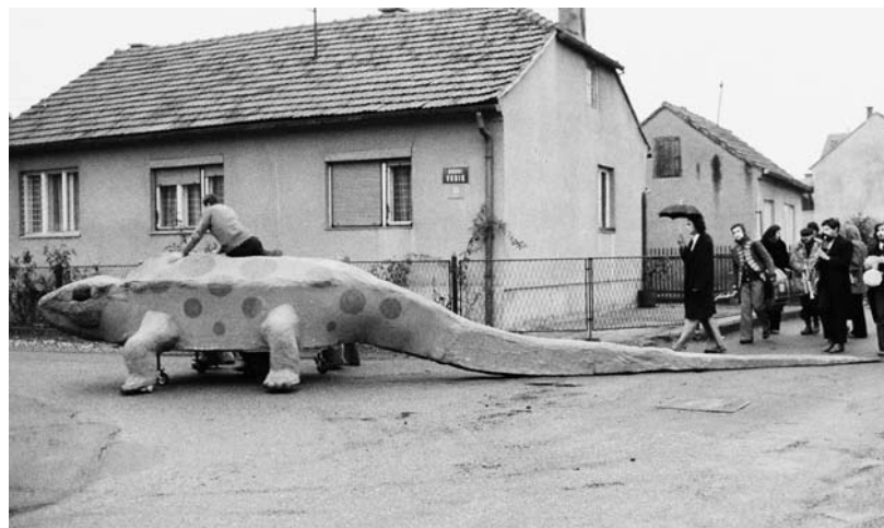
GUŠTERICA MIRKA ILIĆA - MEKANI BRODOVI U ZAGREBAČKOM NASELJU VRBIK