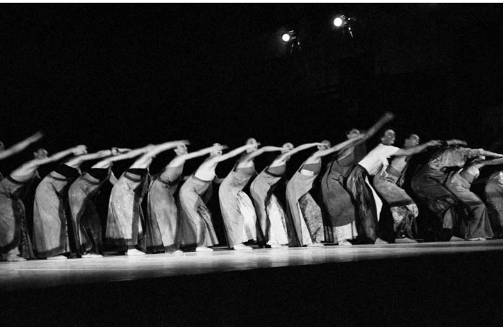
▲ F. Parać – M. Šparembek: Carmina Križijana , Balet HNK Zagreb na DLJI, 1991.