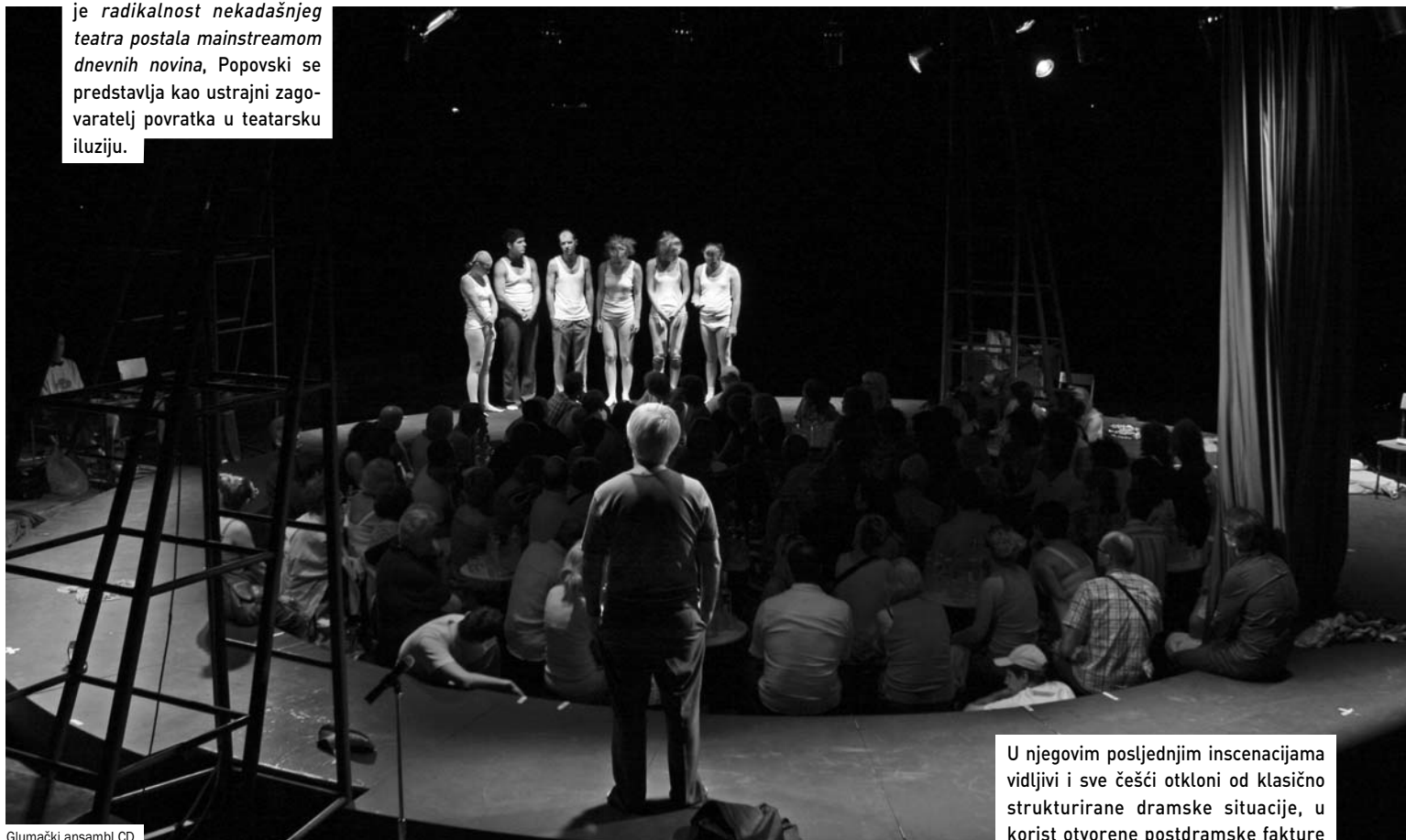
Glumački ansambel CD

Stvarajući u vremenu u kojem je radikalnost nekadašnjeg teatra postala mainstreamom dnevnih novina, Popovski se predstavlja kao ustrajni zagovaratelj povratka u teatarsku iluziju.