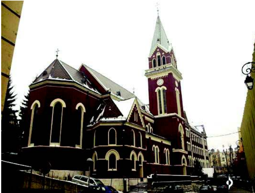
Slika 1. i 2. Crkva sv. Ante na Bistriku, Sarajevo