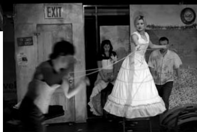
The TEAM, Architecting

RC: Bilo bi prirodnije sastaviti kolaž od hrpe naših visceralnih reakcija na neku ideju nego napraviti priču. Mislim