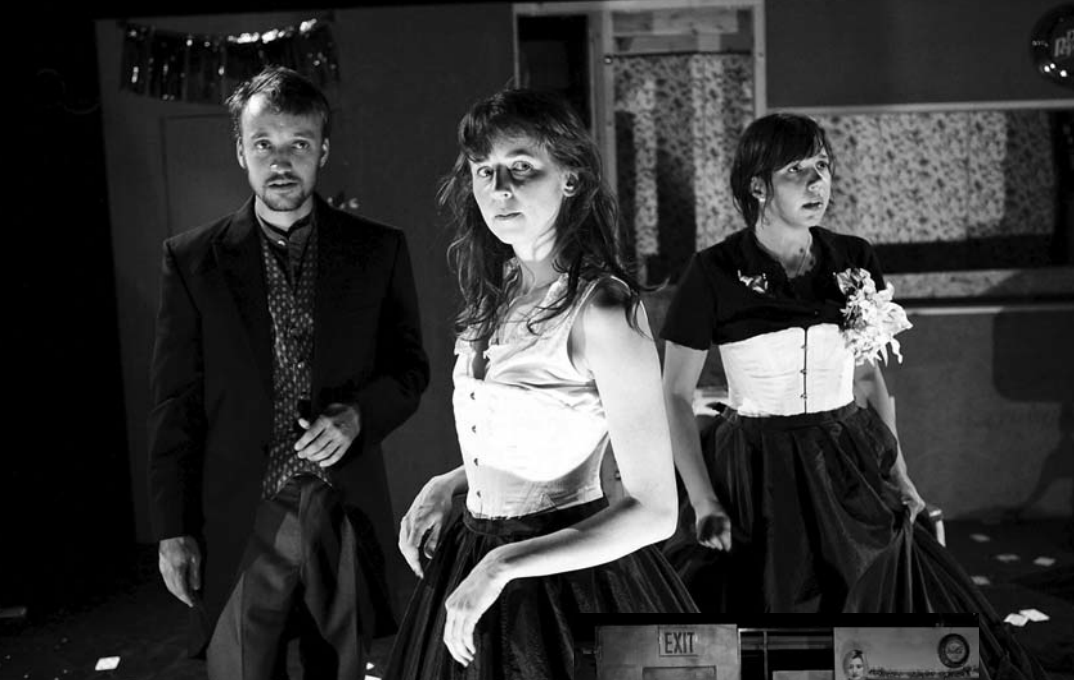
The TEAM, Architecting

nih verzija možemo vidjeti što se razvija i otvoreno razgovarati o tome jesmo li za to zainteresirani ili ne i što bismo napravili drugačije. Izložiti ideje o tome kako bi komad mogao izgledati za nas je ključan proces, čak i kad se odvija brutalno rano u radu na komadu. Znali smo napustiti neke od tih radionica i ponekad radikalno promijeniti sve jer nismo imali osjećaj da radimo ono što želimo, a onda bismo se često dvije radionice kasnije vratili na ideje s te početne radionice. Sve postaje dio taloga iz kojega nastaje trenutna ideja predstave. Ekvivalenti postoje i u kazalištu srednje struje, tome služe probna razdoblja igranja predstave.