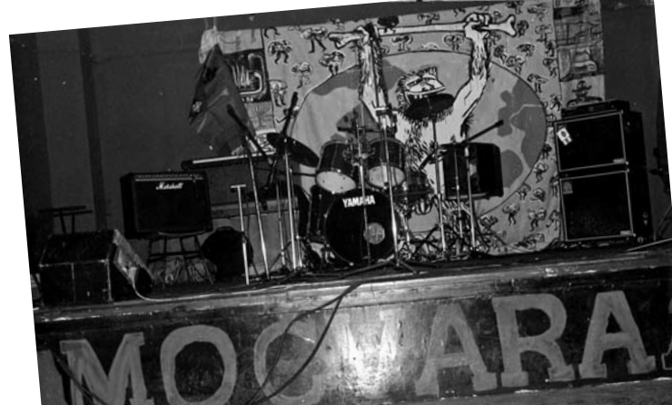
Močvara, Runjaninova ulica

Ubrzo se iskristaliziralo da je za kontinuitet i kvalitetni razvoj nezavisne scene potrebno imati i stalni prostor, klub koji bi postao žarište svih navedenih događanja i ideja. I tako URK 1999. godine unajmljuje skladište u Runjaninovoj ulici (na mjestu današnjega kluba "Krivi put") koje uskoro postaje središte alternativne glazbene ponude grada. Iz te rane faze Močvare bitno je spomenuti suradnju s kazališnim festivalom FAKI (Festival alternativnog kazališnog izričaja) koji je bio svojevrsni probni okvir nezavisne kazališne scene te su tamo neke od svojih prvih performansa izvodili danas etablirani kazalištarci (Anica Tomić, Oliver Frljić, Miran Kurspahić...), a česta su bila i gostovanja "većih" imena. Tako je, na primjer, Zijah Sokolović s monodramom Cabares, cabarei po prvi put nakon rata u Hrvatskoj nastupio baš u prostoru Močvare gdje ga je došao gledati Matko Raguž i nakon toga pozvao ga na suradnju s EXIT-om. Iste godine čak je i Eurokaz jednu