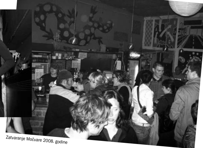
Zatvaranje Močvare 2008. godine

Trebale bi nam stranice i stranice papira da navedemo na tisuće događanja koje su močvarci ponudili gladoj publici: više od tisuću koncerata i glazbenih slušaonica, na stotine izložbi, predstava, filmskih projekcija, druženja, hepeninga, performansa... Kroz prostor Močvare je u proteklih jedanaest godina prošlo gotovo pola milijuna posjetitelja.