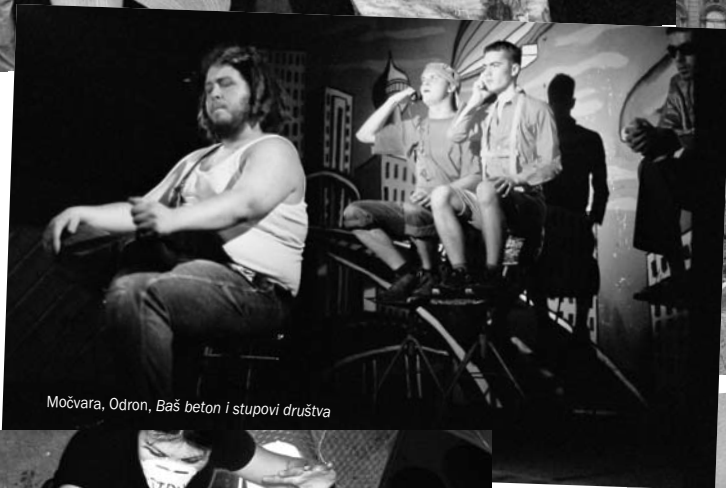
Močvara, Odron, Baš beton i stupovi društva