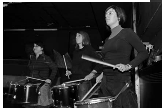
Močvara, Zlobubnjarska radionica