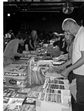
Močvara, sajam stripa i ploča