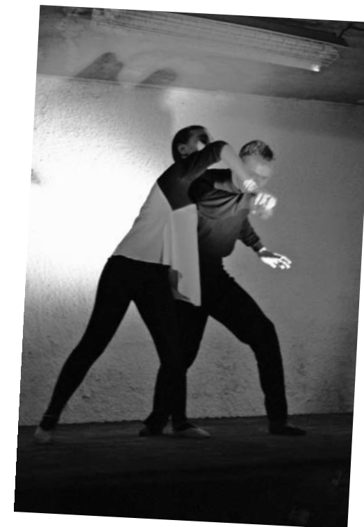
ATTACK!, Theatre de femmes

U proteklom desetljeću Močvara i ATTACK! su bili zatvarani, zabranjivani, kažnjavani pa čak i fizički napadani, što od državnih i gradskih vlasti što od agresivnih političkih neistomišljenika, ali nikada ni na trenutak nisu prestali biti svojevrsni domovi nezavisne kulture u kojima može nastupati svaki izvođač s pozitivnim stavom i namjerama. Danas u njima djeluju razni projekti od kojih valja istaknuti, u Močvari, prestižnu Galeriju Močvara, bogat program KUM (Kazalište u Močvari) koji ugošćuje brojne važne kazalištarce iz regije i svijeta 1 te etno radionice Dunje Knebl koje su potaknule mnoge mlade glazbenike na ozbiljno proučavanje domaće baštine, a u ATTACK!-u, više puta spomenuti FAKI, radionice novocirkuskih vještina te čitav niz ostalih programa koji obogaćuju ponudu grada. Nezanemariva je i činjenica da klub Močvara jedini u cijeloj državi vodi radionice tehničke poduke za rad u umjetnosti. Na tim radionicama su mnogi danas cijenjeni majstori rasvjete i zvuka stekli svoje prve spoznaje o tim često zanemarivanim aspektima glazbeno-scenskoga stvaranja. Močvara i AKC Medika više nisu jedini alternativni klubovi u gradu. Nezavisna scena je danas jača nego ikada te