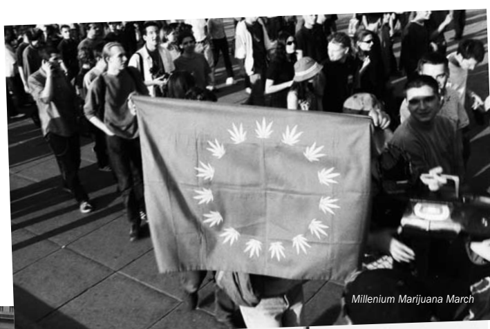
Millenium Marijuana March