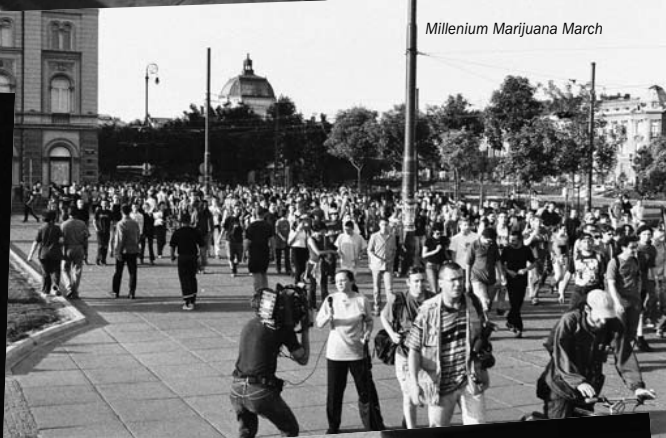
Millenium Marijuana March