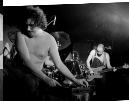
Močvara, Tigrova mast