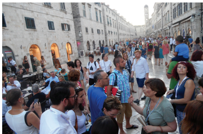
Slika 3 – Izlet u Dubrovnik i obilazak stare gradske jezgre

i DNA/RNA. Niz drugih zanimljivih predavanja i ugledni predavači privukli su velik interes sudionika kongresa pa su predavanja bila odlično posjećena.