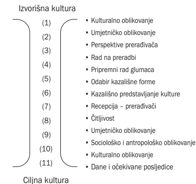
Dijagram 3: Pavisov model pješčanog sata interkulturalnoga kazališta

Glavni problem ovog modela jest to što pretpostavlja kulturni protok u jednome smjeru, temeljen na hijerarhiji privilegije, iako Pavis pokušava relativizirati odnose moći tvrdeći da se pješčani sat može okrenuti naopak "čim se oni koji koriste stranu kulturu zapitaju na koji način mogu učiniti da njihova kultura komunicira s drugom ciljnom kulturom" (1992:5). Ipak, ta tvrdnja pretpostavlja da postoji "ravnopravnost" među partnerima u razmjeni te ne uzima u obzir činjenicu da su prednosti globalizacije i propustljivosti kultura i političkih sustava različito dostupni različitim zajednicama i nacijama.