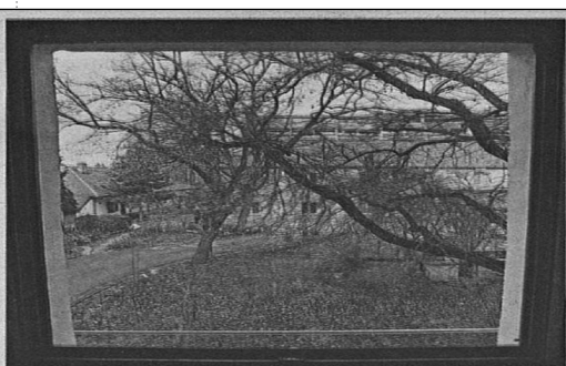
Pogled na lipe Kroz prozor je gledao na desetak lipa koje su i danas tamo

Vlasnik stana tražio je od grada da na zgradu u kojoj je pjesnik živio postave spomen-ploču