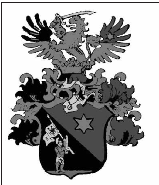
Sl. 4. Grb Rukavina s pridjevkom "Morgenstern"