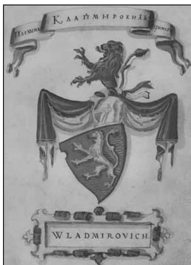
Sl. 1. Grb Vladimirovića (Korjenić – Neorićev grbovnik iz godine 1595.)