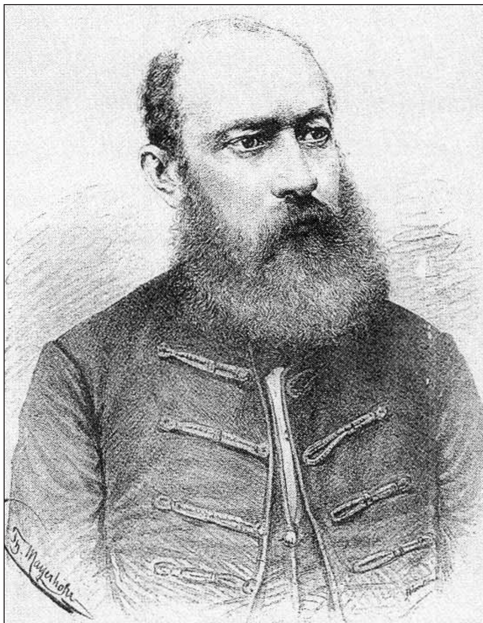
Sl. 10. Barun Juraj (Đuro) Rukavina (Trnovac, 1777. – Temišvar, 1849.)