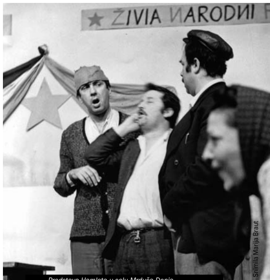
Predstava Hamleta u selu Mrduša Donja

Kulturalno gledano, čini se da problem današnjeg &TD-a nije toliko njegova “rigidno estetska opcija”, koliko temeljna činjenica da se u toj opciji ovo kazalište nije uspjelo uzdići do respektabilnog nivoa. Povijest kazališne avangarde već nam je dobro poznata i koliko god tradicionalisti pričali da im je ta povijest nerazumljiva, u svojim sjajnim izdancima ta avangarda je zaista bila fascinantna. Ako je s druge strane točna pak Brechtova misao