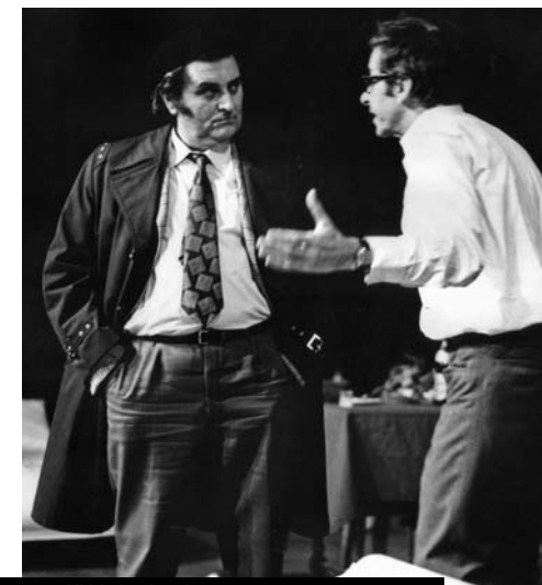
Miriši, zlato i tamjan

Onaj prethodni Teatar &TD ostavio je iza sebe sjećanje na jedan veliki kulturni i intelektualni značaj, ali u stvarnosti je nakon svega ostavio veliku estetsku provaliju koju mlade generacije više ne mogu premostiti. Priča o (starom) &TD-u nije priča o nostalgiji i dobrim starim vremenima, nego o – odgovornosti. Ta odgovornost – kako u svemu tako i u kazalištu – leži u tome da prošla generacija mora ostaviti onoj budućoj neki kvantum stručnih, estetskih i društveno-kritičkih prosudbi kako ovima što dolaze ne bi bilo dvostruko teže. Tako nešto onaj prethodni Teatar &TD nije učinio pa “kultura promjene” danas u tom istom kazalištu kreće od nule i slični na pomalo očajnički zahvat mladih s neizvjesnom budućnošću.