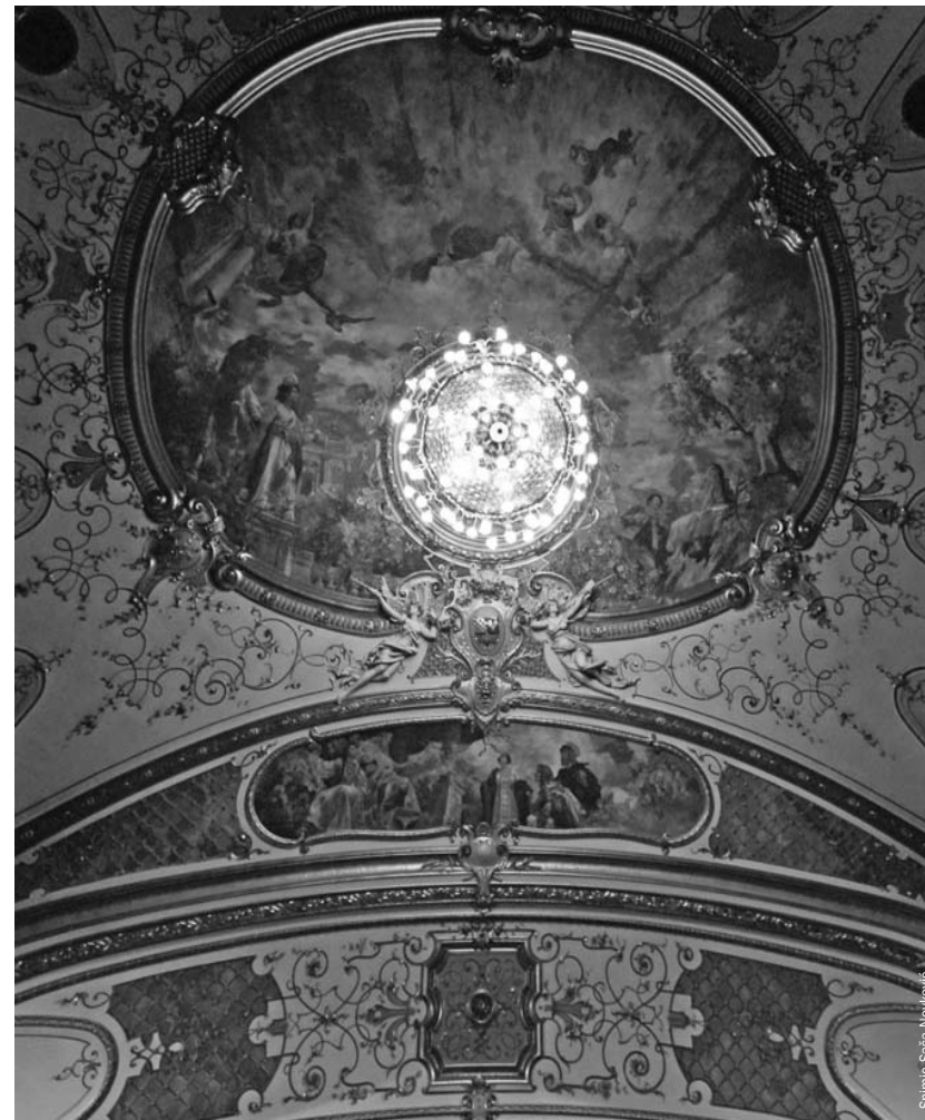
Sinhio Saša Novković