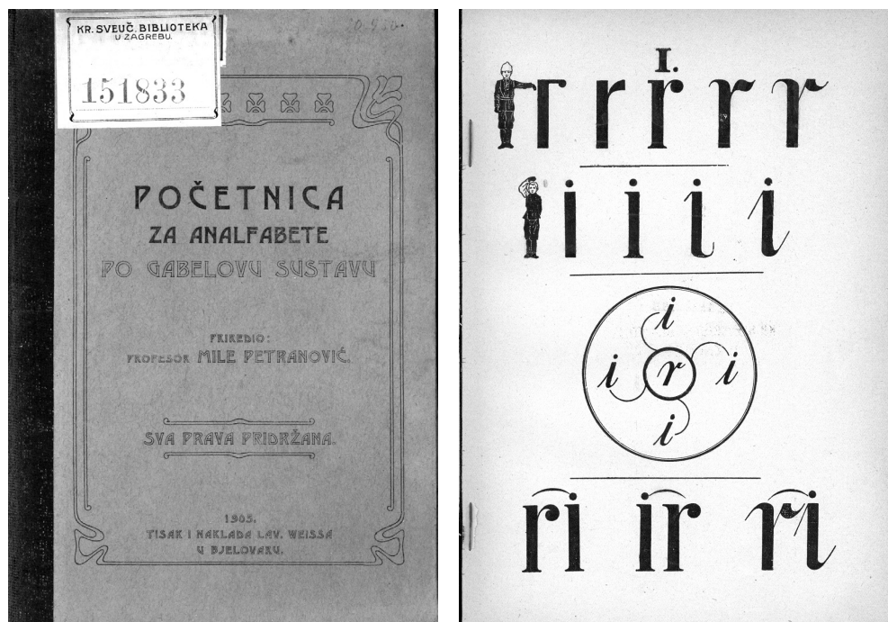
Slika 3. i 3a Mile Petranović: Početnica za analfabete po Gabelovu sustavu

Iz već spomenutog nekrologa saznajemo da je u kalendarima objavio i stručnu raspravu Život i djelovanje Ferde Rusana , a u Viencu raspravu Žena u narodnoj pjesmi .