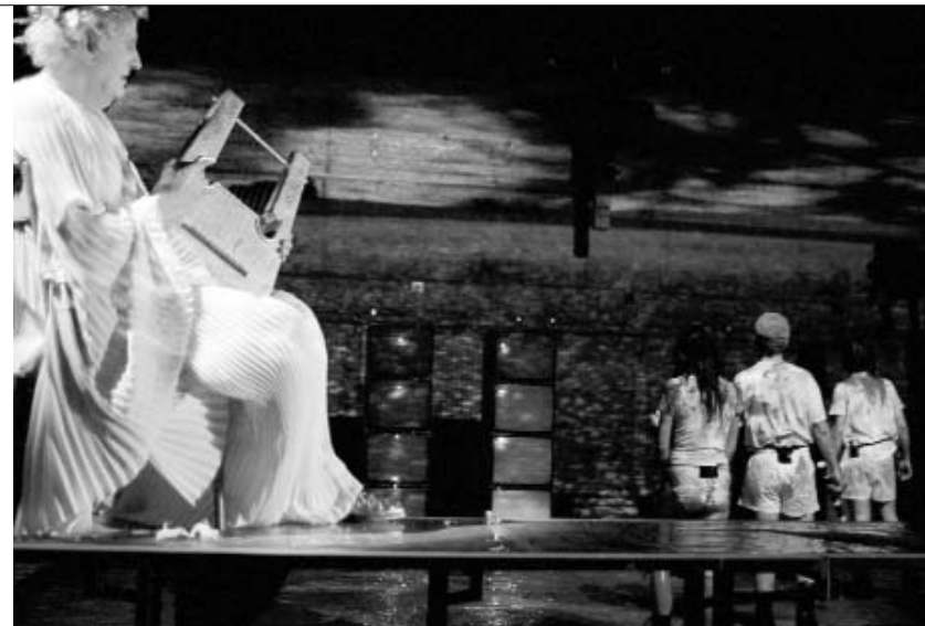
Elfriede Jelinek, Babilon

Taj je svijet nazvao “Rocky-Horror-Political-Picture Show”, a u njemu ulašteni likovi u površnim televizijskim emisijama govore o socijalnim krizama, ratovima i ratnim ugovorima. Kazališnim jezikom se o tome može iskrenije i dublje progovoriti, a Stemann će se u svojim predstavama i dalje, dodaje na kraju, baviti politikom, društvom i prije svega moralnošću.