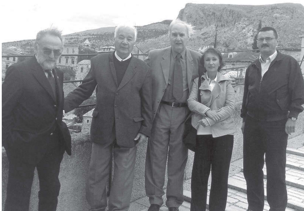
Djelatnici Hrvatske akademije znanosti i umjetnosti u Mostaru