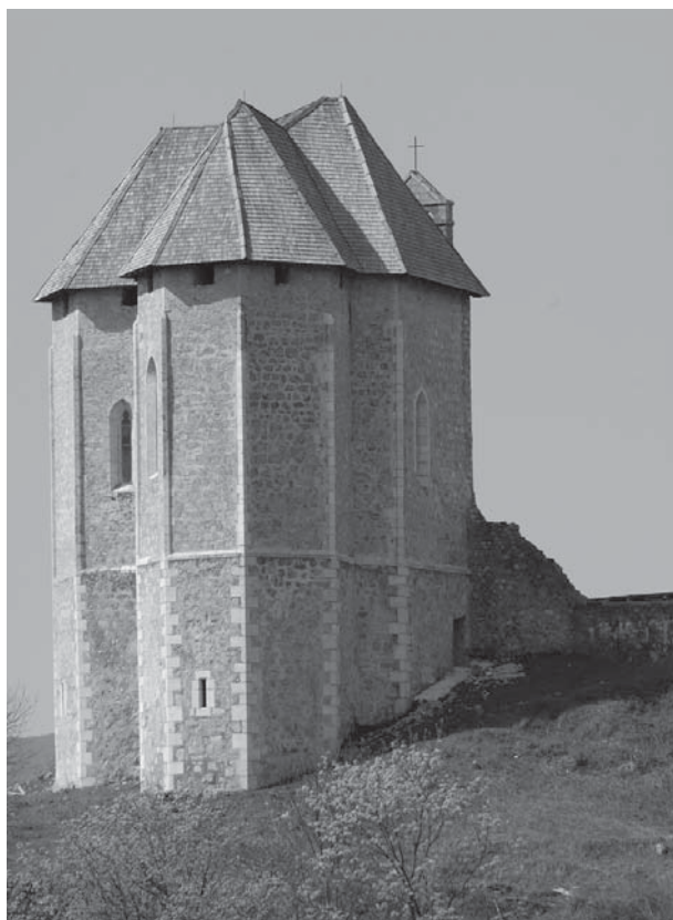
3. Brinje, kapela sv. Trojstva, pogled s istoka nakon radova 2009. (snimio V. Barac) / Brinje, Chapel of the Holy Trinity, view from the east after restoration, 2009 (photo V. Barac)

kapelu bila je izvedba odvojenih stuba kojima se pristupa brodu i empori. Nema nikakve dvojbe da se empori pristupalo drvenim trijemom, neposredno s prvoga kata sjevernije smještenog palasa, a brodu iz dvorišta uz zapadno pročelje prislomljenim drvenim stubama. Odmah u početku odbačena je mogućnost da nova stubišta budu drvena, prije svega zbog uvijek i svugdje kod nas prisutnog problema nadziranja i održavanja takve visoke drvene i stoga potencijalno opasne konstrukcije. Stoga smo se opredijelili za materijale koji imaju dugu trajnost i koji dulje razdoblje neće zahtijevati nikakvo održavanje. Uz to smo željeli stubište koje će biti oblikovano na način da u najmanjoj mogućoj mjeri zaklanja pogled na pročelje i posebno da ne zaklanja veliki ljevkašti portal empure. Također smo željeli izbjeći prskanje i slijevanje vode po zidovima za vrijeme kiša te zadržavanje snijega na stubama. Zbog svih tih razloga opredijelili smo se za suvremeno oblikovanje i materijale – metalno stubište s vruće cinčanom nosivom čeličnom konstrukcijom i rešetkastim protukliznim gazištima stuba i podesta te ogradom od cijevi s tankom užadi u parapetima ograda, sve od inoxa.