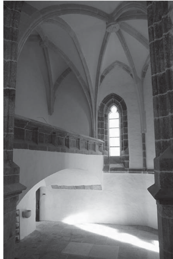
7. Brinje, unutrašnjost, pogled iz bočne kapele na emporu u brodu nakon radova 2009. / Brinje, interior, view from the side chapel towards the matroneum in the nave after restoration, 2009