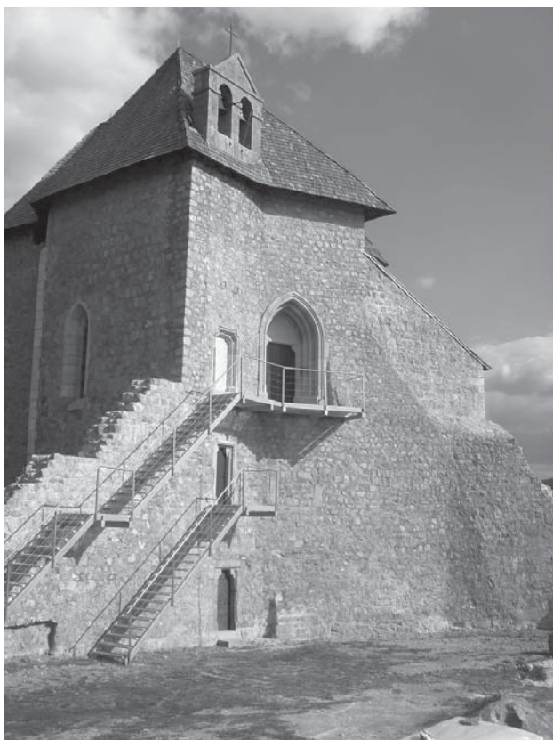
2. Brinje, kapela sv. Trojstva, pogled sa zapada na glavno pročelje nakon radova 2009. / Brinje, Chapel of the Holy Trinity, view from the west to the main façade after restoration, 2009