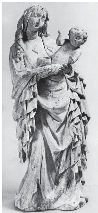
8. Brinje, kapela sv. Trojstva, Madona s malim Isusom , stanje nakon uklanjanja preslika / Brinje, Chapel of the Holy Trinity, Madonna with Child , state after removal of overpainting

Prometna izolacija Brinja koja je nastupila nakon puštanja u promet ličke željezničke pruge, kao i iznimno loše građevinsko održavanje kapele sv. Trojstva, sputavalo je njezino objektivno sagledavanje i valoriziranje unutar gotičkog sakralnog graditeljstva kontinentalne Hrvatske. Na samom početku, u prvom vrlo detaljnom opisu kapele sv. Trojstva, Ivan Kukuljević Sakcinski zaključuje: »U građevnom pogledu spada brinjska crkva među najzanimljivije spomenike svoje dobe u Hrvatskoj.« Na kraju izražava nadu »da će občinstvo i mjerodavna mjesta obratiti pozornost svoju na ovaj velevažni i zanimivi spomenik iz hrvatske prošlosti i nastojati da se uzčuva.« 24 Gjuro Szabo nakon kraćeg opisa suzdržano zaključuje: »U svemu je ta kapele jedinstven spomenik graditeljstva, napose graditeljstva