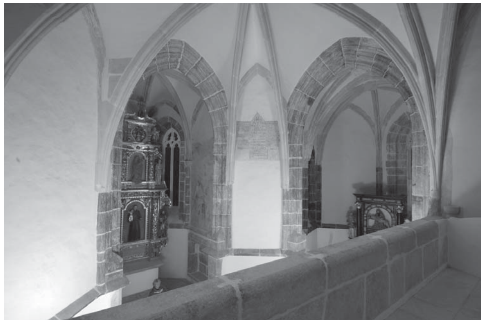
6. Brinje, unutrašnjost, pogled s empole na svetište i bočnu kapelu nakon radova 2009. / Brinje, interior, view from the matroneum towards the chancel and side chapel after restoration, 2009