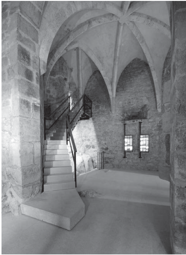
5. Brinje, kapela sv. Trojstva, substrukcija, pogled na novo stubište i izložbeni prostor 2007. / Brinje, Chapel of the Holy Trinity, substructure, view of the new staircase and exhibition space, 2007