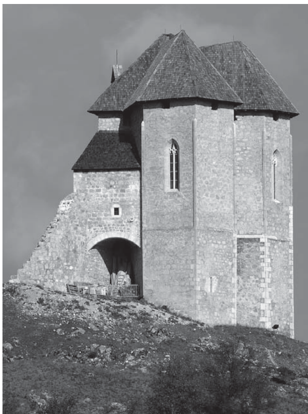
4. Brinje, kapela sv. Trojstva, pogled s juga nakon radova 2009. / Brinje, Chapel of the Holy Trinity, view from the south after restoration, 2009

Zagrebu. 20 Nakon što je postalo aktualno vraćanje oltara u obnovljenu kapelu, stav Hrvatskog restauratorskog zavoda bio je da je na temelju količine, kvalitete i dostatnosti podataka za svaki dio sačuvanog izvornog oslika i pozlate opravdan postupak njegove rekonstrukcije, koja se namjeravala izvesti akvarelnim bojama, dakle postupkom koji se po potrebi može ukloniti vrlo lako i bez ikakvih neželjenih posljedica.