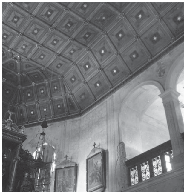
8. Svetište crkve u Dubrancu s vidljivim oštećenjima iz Drugog svjetskog rata; Fototeka Uprave za zaštitu kulturne baštine, Ministarstvo kulture, Zagreb (snimio V. Bradač, 1955); inv. br. 17470, br. neg. II-3256 / Chancel of the church in Dubranec with visible Second World War damage (Ministry of Culture, Croatian Cultural Heritage Photo Library, Zagreb (photo V. Bradač, 1955); inv. n. 17470, neg. II-3256)

Proučavajući srednjovjekovne elemente katedrale, pažnju joj počinju privlačiti i intervencije prve polovice i sredine 19. stoljeća u toj građevini, što je još jedan odraz afiniteta