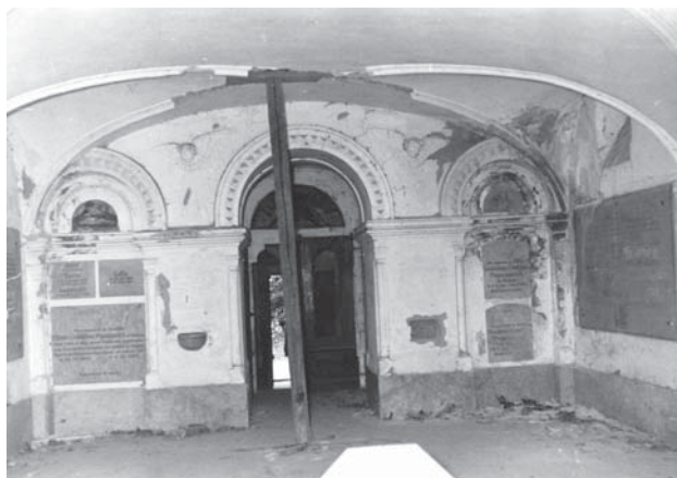
7. Unutrašnjost devastirane kapele Pejačevića u Našicama; Fototeka Uprave za zaštitu kulturne baštine, Ministarstvo kulture, Zagreb (snimio N. Vranić, 1958); inv. br. 19699, br. neg. I-e-155 / Interior of the devastated Pejačević family chapel in Našice (Ministry of Culture, Croatian Cultural Heritage Photo Library, Zagreb (photo N. Vranić, 1958); inv. n. 19699, neg. I-e-155)