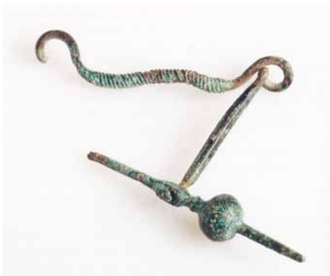
SL. 3. / FIG. 3.

This fibula lacks foot, bow segment next to the foot and tip of the pin. The bow is saddle-shaped, with one loop at each end of the sunken part. Central part of the bow is decorated with false twisting (pseudo-twisting). Flat part of the bow next to the head is undecorated. Pin head is bulbous, with a point in shape of a very elongated cone. The pin is decorated with incisions. Short slanted lines decorate the bulb, around the base of the point. The pin has round cross-section, end of the bow passes through prism-shaped joint. Small disc-shaped expansion is between the end of the bow and the bulb. The joint is decorated on both lateral sides with a lying hourglass, and disc-shaped expansion and back edges around the joint with transversal notches. It is covered with green patina and corroded at places. Length of the central part of the bow 7,4 cm, length of the lateral part of the bow 6 cm, pin length 7 cm, width of pin head 1,4 cm, m 24,5 g; bronze. Kept in the Franciscan Monastery in Sinj, Archaeological Collection, inv. no. P 279. Bibliography: B. ŽUPIĆ, 2008, 50, No. 57.