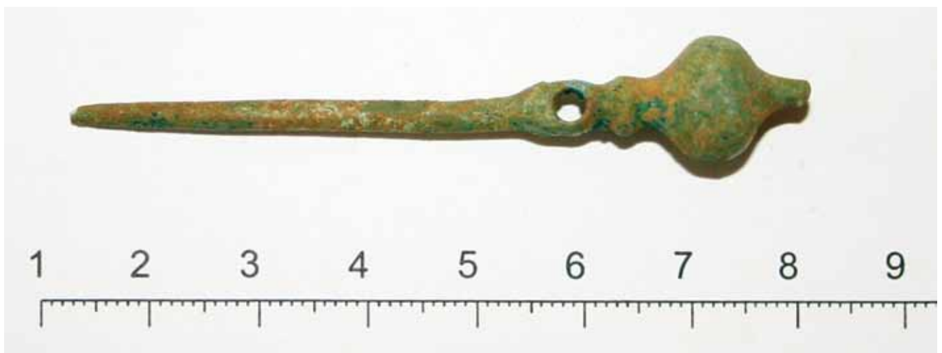
SL. I. / FIG. I.

Find from an inhumation grave no. 20. Osteological analysis revealed that the grave contained bones of at least three adults and two children; excavations by the Šibenik City Museum in the year 2003. Pin of a serpentine fibula with a hole for attaching the bow, fragmented. A rib is in continuation, and then a bulbous head with a point whose tip is missing. Length 69 mm; Accompanying finds: six pins of fibulae, foot fragment of a Certosa fibula, foot fragment of a Baška type fibula, bow of a Certosa fibula, type VII f, bracelet, four rings, two hairpins, spiral pendant, fragmented basket-shaped pendant, crotchet fragment, seven amber beads, polygonal faceted bead. Dating of the grave: 1st – 3rd centuries. Kept in the Šibenik City Museum, Šibenik. Bibliography: D. GLOGOVIĆ, 2014, 22, 42, Br.14, T. 13 a, 13 b.