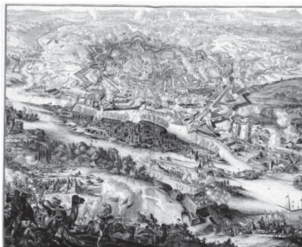
8. Sedmogodišnji rat, Bombardiranje Le Havrea, nakon 4. srpnja 1759. / Seven Years' War, The Bombing of Le Havre, after 4 th July 1759.