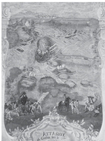
2. Bitke kod Görlitza (7. rujna 1757.) i Lobositz (1. listopada 1756.) / The Battles of Görlitz (7 th September 1757) and Lobositz (1 st October 1756)