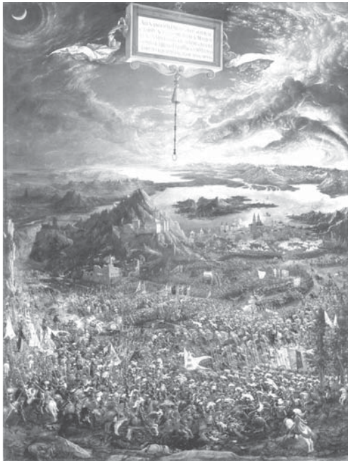
5. Albrecht Altdorfer, Aleksandrova bitka kod Isse, 1529. , Alte Pinakothek, München / Albrecht Altdorfer, The Battle of Alexander at Issus, 1529 , Alte Pinakothek, Munich