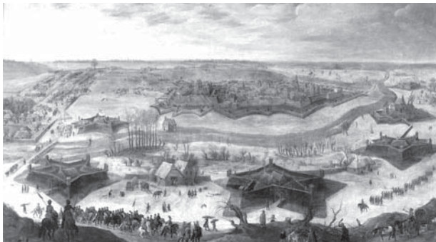
6. Peter Snayers, Opsada Gulika pod komandom Hendrika van den Bergha, 1622. / Peter Snayers, The Siege of Gulik under the command of Hendrik van den Bergh, 1622.