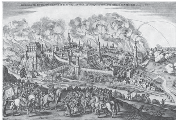
7. Tridesetgodišnj rat (1618.–1648.), Opsada Bautzena 1620. / Thirty Years' War (1618-1648), The Siege of Bautzen 1620.