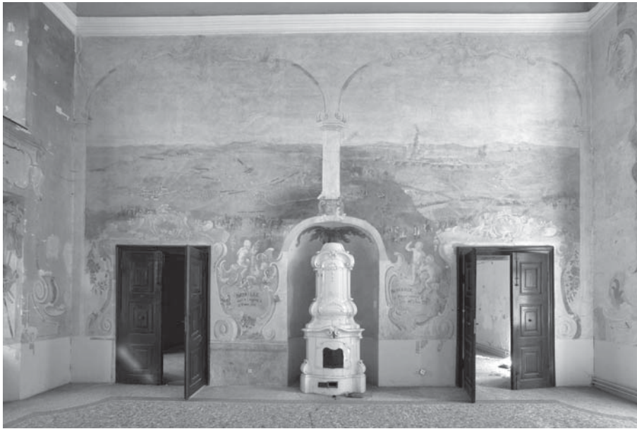
1. Dvorac Brezovica, nekadašnja ceremonijalna dvorana / Brezovica Castle, former ceremonial hall

su prizorima iz Sedmogodišnjeg rata (1756.–1763.), po dva na svakom zidu, različitih formata, ovisno o smještaju na zidnoj plohi, uokvirena elementima arhitekture i ornamentima rokaja, tako da se, osobito na istočnom i zapadnom zidu, dobiva dojam kako se sve bitke sagledavaju ležerno iz udobnosti vlastitoga doma sa široko otvorenih verandi. Štoviše, cjelina je zasnovana poput drvenih rococo zidnih oplata dekoriranih ornamentima, trofejnim i biljnim motivima – panneaux de boiserie .