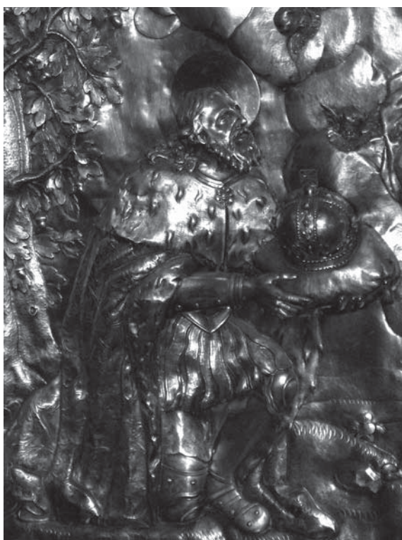
7. Georg Caspar Meichel, Sv. Stjepan – detalj antependija glavnoga oltara zagrebačke katedrale, 1721., in situ / Georg Caspar Meichel, St Stephen – detail of the antependium of the main altar of Zagreb Cathedral, 1721, in situ