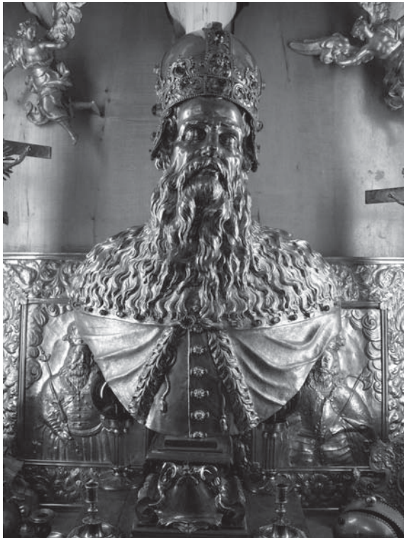
1. Alessandro Algardi – neznani zlatarski majstor, Relikvijar sv. Stjepana , 1635., Zagreb, Riznica katedrale / Alessandro Algardi – Unknown goldsmith, Reliquary bust of St Stephen , 1635, Zagreb, Cathedral Treasury