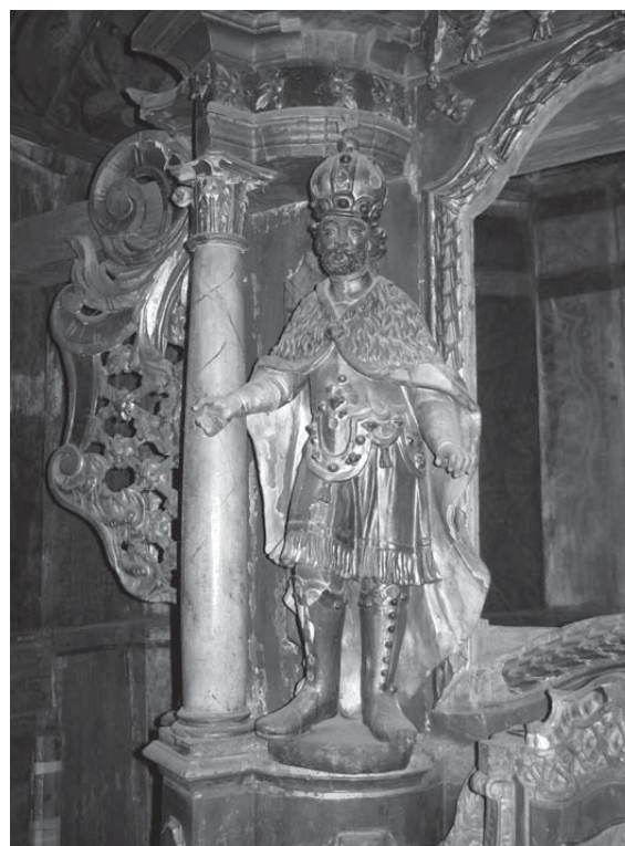
8. Antun Reiner, Sv. Ladislav , oko 1750., Bok Palanječki, kapela svetih Petra i Pavla, glavni oltar. / Antun Reiner, St Ladislaus , c. 1750, Bok Palanječki, Chapel of SS. Peter and Paul, main altar

stan posvećen sv. Petru u Okovima ( San Pietro in Vincoli ). 26 Prisutnost skorašnjega (1631.) bosanskoga biskupa u glasovitoj rimskoj knjižnici, kao i njegov prislan odnos s njezinim vlasnikom vrijedno je popratiti komentarom Armina Pavića (1875.) koji Mrnavićev uspjeh u Rimu sažima riječima: »Ako je Mrnavić već za pape Grgura XV. (1621.–8/7 1623.) svojim zaslugama oko propagande u Rimu bio velik upliv zadobio, taj upliv posta još veći odkako tamo kardinal Maffeo Barberini posta papom Urban VIII. (6/8 1623. – 29/7 1649. [sic!]) jerbo taj Barberini bijaše stric (patruus) kardinala Franje Barberina, koji opet bijaše osobit zaštitnik našega Mrnavića.« 27 Kardinalovo podsjećanje na vezu sv. Stjepana i u 17. stoljeću već odavno zaboravljenoga ravnatskoga samostana 28 očito je trebalo poslužiti kao povijesni primjer kraljeve povezanosti s Rimskom Crkvom te dodatno potaknuti vjernost onih koji su ga smatrali svojim osobitim zaštitnikom. I sama rimska ceremonija predaje relikvijara – koju je privlačno smatrati plodom zamisli začete u kardinalovoj knjižnici nekoliko godina prije – bila je obilježena snažnim iskazom vjernosti Hrvatsko-Ugarskoga Kraljevstva: U znak zahvalnosti za skupocjeni dar dvanaestorica pitomaca Njemačko-ugarskoga kolegija ( Collegium Germanicum et Hungaricum ) mađarske i hrvatske