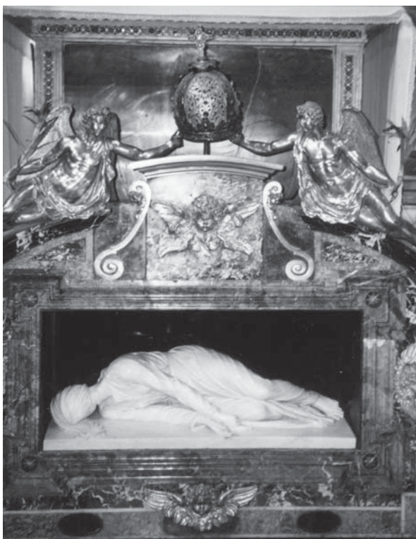
3. Stefano Maderno, Sv. Cecilija , 1600., Rim, Santa Cecilia in Trastevere / Stefano Maderno, St Cecilia , 1600, Rome, Santa Cecilia in Trastevere