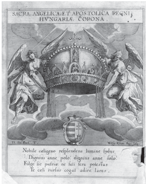
* 5. Wolfgang Kilian, Sacra angelica et apostolica Regni Hungariae corona , naslovna grafika knjige Pétera Révaya, De sacræ Coronæ Regni Hungariæ , Augsburg, 1613. / Wolfgang Kilian, Sacra angelica et apostolica Regni Hungariæ corona , title illustration of Péter Révay, De sacræ Coronæ Regni Hungariæ , Augsburg, 1613