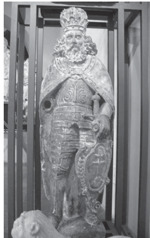
6. Neznani kipar, Sv. Ladislav – sa staroga portala zagrebačke katedrale, 1640-te, Zagreb, Muzej grada Zagreba / Unknown sculptor, St Ladislaus – from the old portal of Zagreb Cathedral, 1640s, Zagreb City Museum

ratovima i osmanskim opasnošću bremenitoga 17. stoljeća. Tako u svojem Životopisu sv. Stjepana u djelu »Regiæ Sanctitatis Illyrricanæ Foecunditas« Mrnavić (1630.) navodi: »Kada su sve ostale crkve Ugarske kraljevine bilo dospjele pod turski jaram, bilo se obesčastile ljagom hereze, jedina je od katedralâ u čitavoj kraljevini naša [Zagrebačka], posvećena presvetom apostolskom kralju [sv. Stjepanu], posve slobodna [i] čista od turske sile i heretičke ljage, bila trajno privržena apostolskom tronu.« 20 U razdoblju nakon Mohačke bitke (1526.) Ugarska je zaista proživljavala duboku političku i vjersku krizu. Krajem 16. stoljeća, neposredno prije prvih pokušaja rekatolicizacije koja se početkom 17. stoljeća počinje provoditi na području pod kontrolom Habsburgovaca, protestantizam je zahvatio oko osamdeset posto ugarskoga stanovništva. 21 Ako im je osmanska prijetnja i bila zajednička, hrvatski staleži ubrzo su kao sredstvo svoje emancipacije od ugarskih počeli naglašavati upravo već spomenutu pravovjernost koja se očuvala u okvirima Zagrebačke dijeceze kao najveće i najmoćnije u kraljevstvu Hrvatske i Slavonije. 22 Zanimljivo je da se pri tome, poput Mrnavića, često služe povijesnim autoritetom svetih ugarskih kraljeva Stjepana i Ladislava, ističući njihovu lokalnu ulogu zaštitnika i osnivača svoje biskupije. Tako je budući