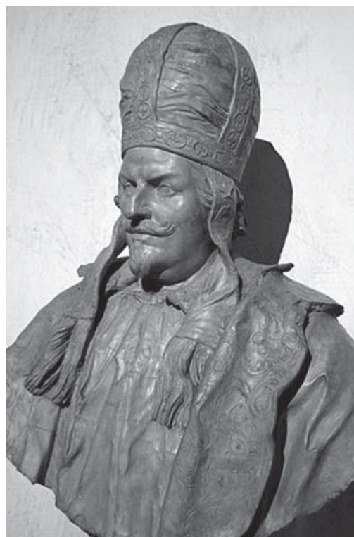
4. Neznani kipar, Taddeo Barberini kao rimski prefekt , nakon 1631., Rim, Museo di Roma / Unknown sculptor, Taddeo Barberini as the Prefect of Rome , after 1631, Rome, Museo di Roma ( http://en.wikipedia.org/wiki/File:Taddeo_Barberini_clay_sculpture.JPG )

domaćih i stranih istraživača, 11 a temeljem stilske interpretacije o njegovoj se kruni počelo promišljati odvojeno od samoga poprsja. Nedavno je (2010.) Daniel Premerl iznio složen povijesni okvir koji je potaknuo nastanak poprsja te njegovu elaboriranu i uvjerljivu atribuciju rimskom kiparu Alessandu Algardiju. 12