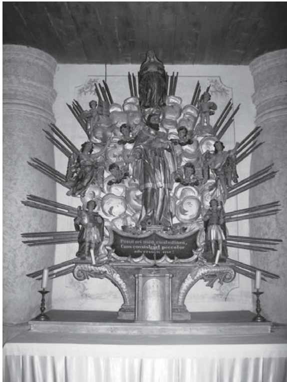
1. Volavje, crkva Bl. Dj. Marije Volavske/Snježne, oltar sv. Ivana Nepomuka, neznani autor, 1741. g. (snimila M. Ožanić, 2010.) / Volavje, Church of Our Lady of Volavje/Snow, Altar of St John of Nepomuk, unknown author, 1741 (photo M. Ožanić, 2010)