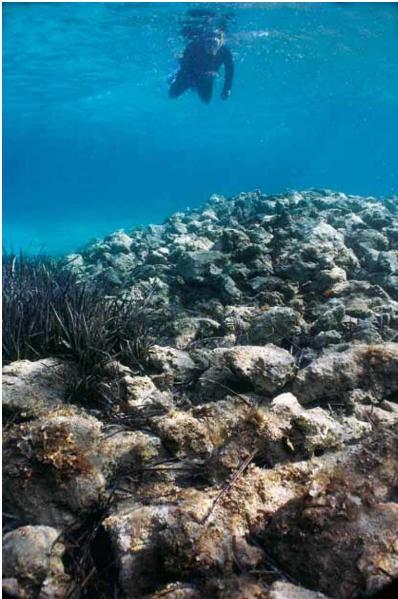
SL. 8. / FIG. 8.

Zdenko Brusić u obilasku lokaliteta prije prvih istraživanja.