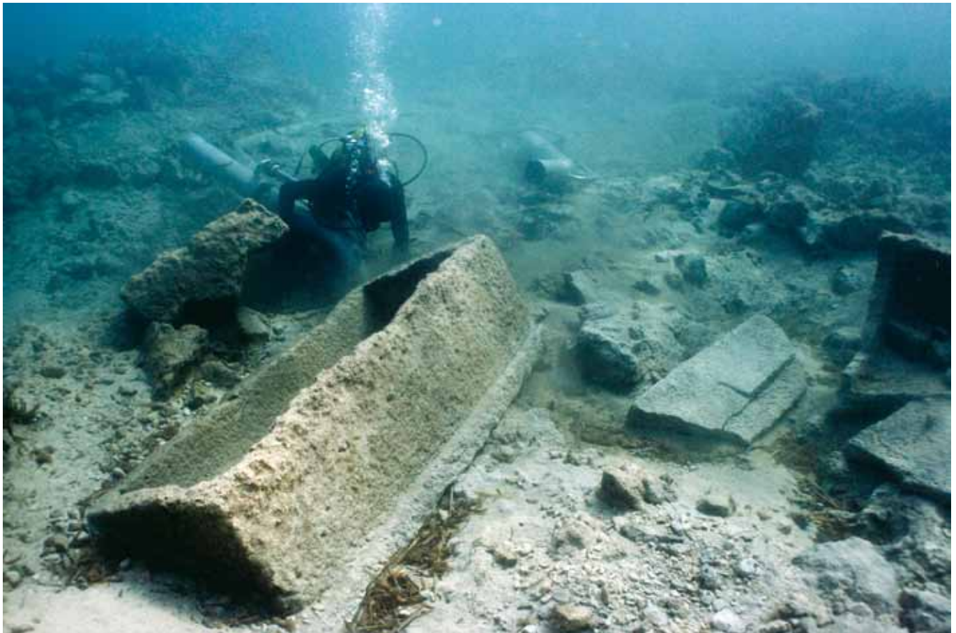
SL. 7. / FIG. 7.

Spoliji sarkofaga na nalazištu.