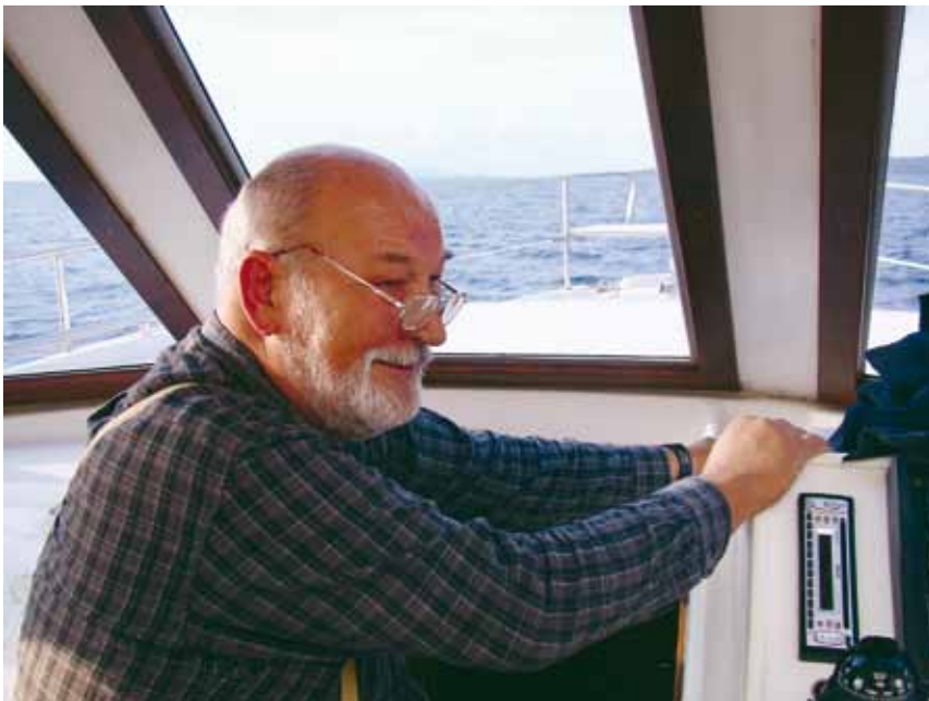
SL. 3. / FIG. 3.

Systematic underwater excavations in Pocukmarak bay commenced after Zdenko Brusić (Fig. 3) noticed sarcophagus fragments in the stone embankment. Five short-term campaigns were conducted from 2008 to 2013 led by Zdenko Brusić.