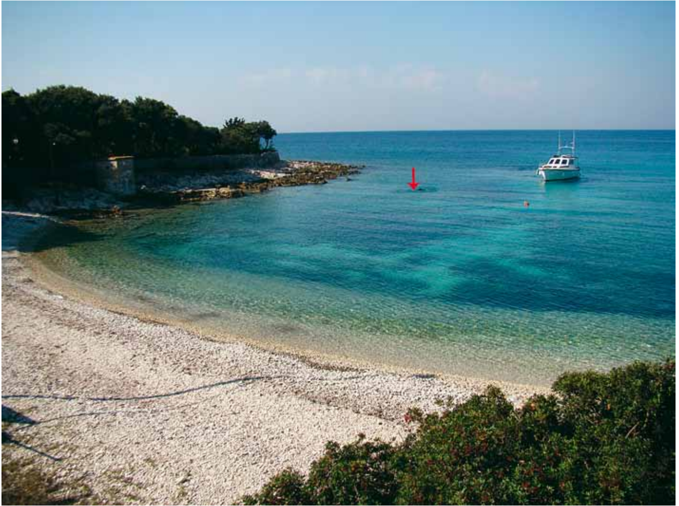
SL. 6. / FIG. 6.

Uvala Pocukmarak s označenim položajem lokaliteta.