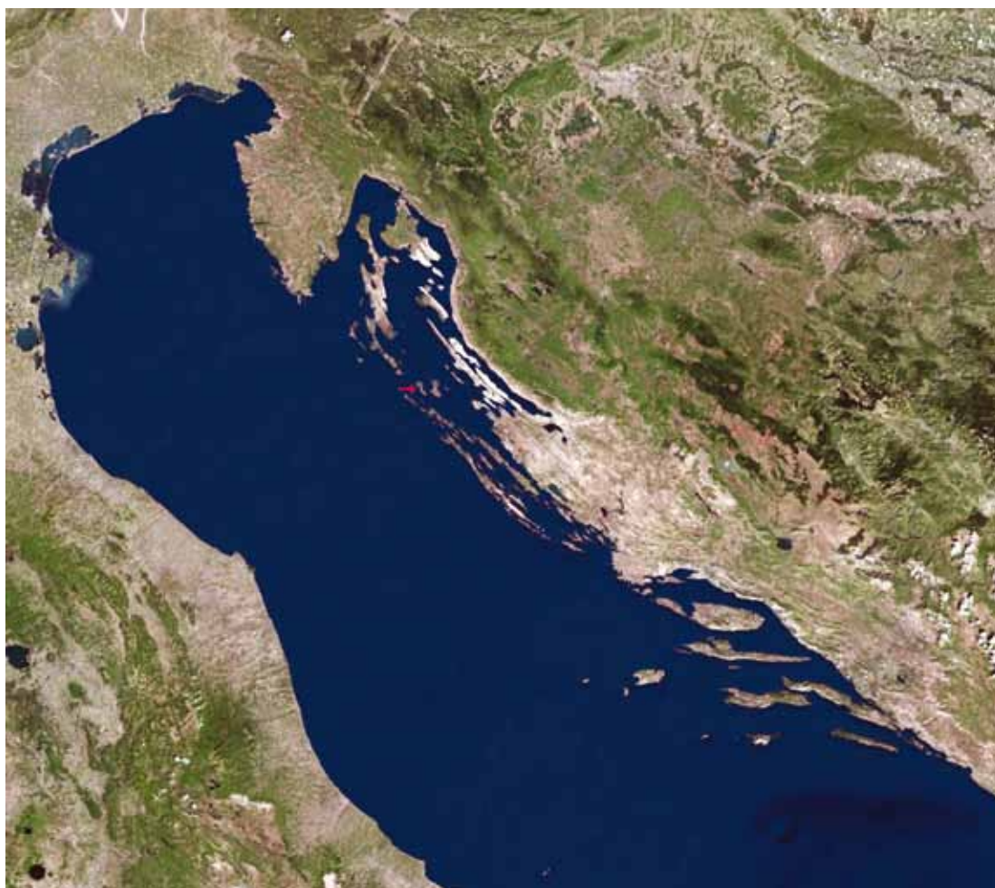
SL. 2. / FIG. 2.

Otok Silba s označenim položajem uvale Pocukmarak. The island of Silba with position of Pocukmarak bay marked.