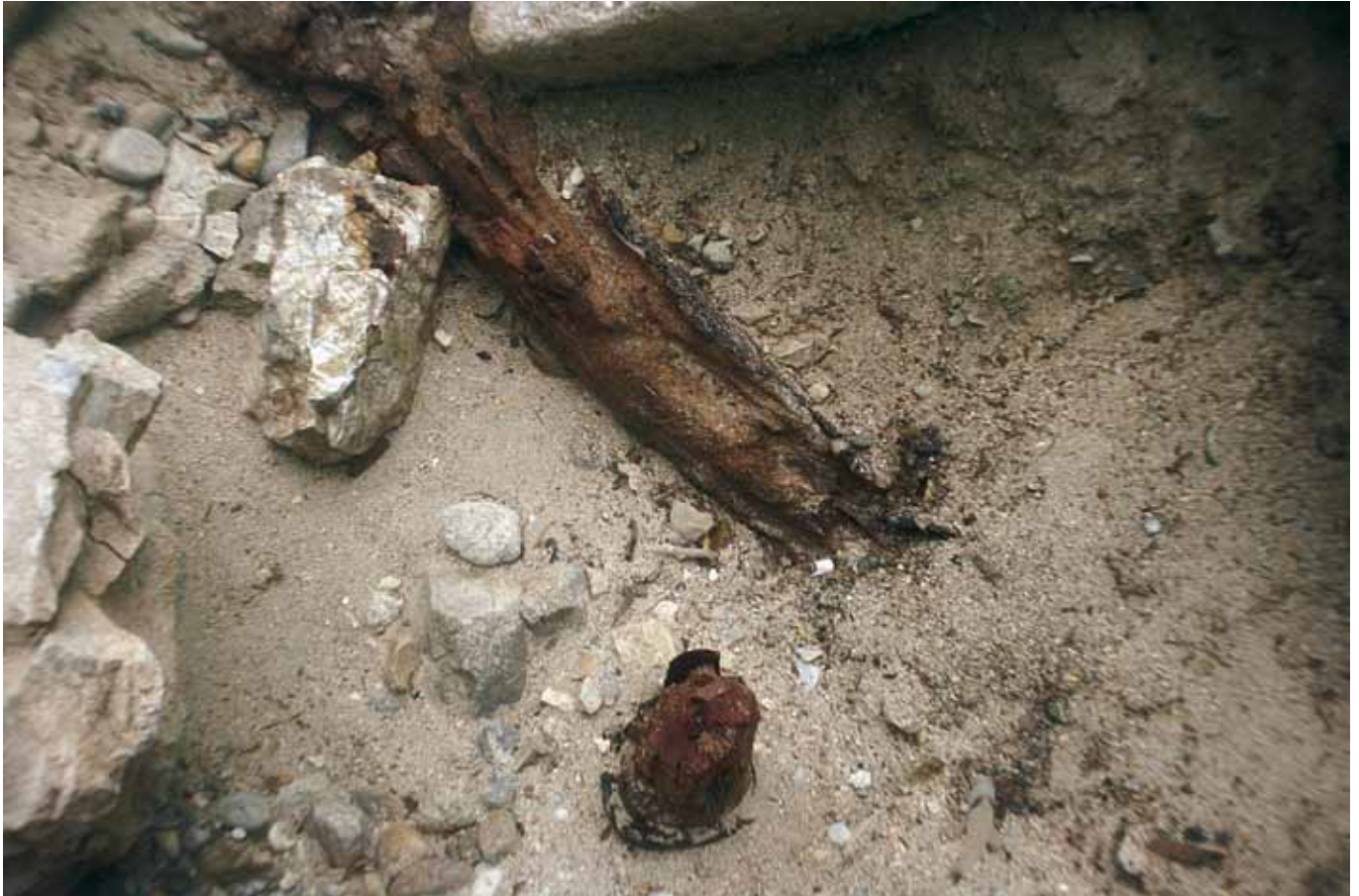
SL. 9. / FIG. 9.

Drvena greda i pilon zabijen u morsko dno.