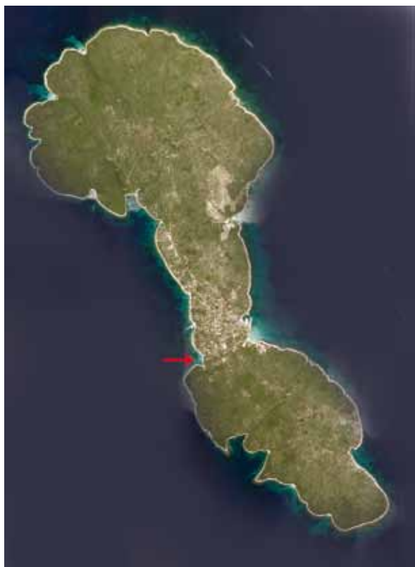
SL. 1. / FIG. 1.

Otok Silba s označenim položajem uvale Pocukmarak. The island of Silba with position of Pocukmarak bay marked.