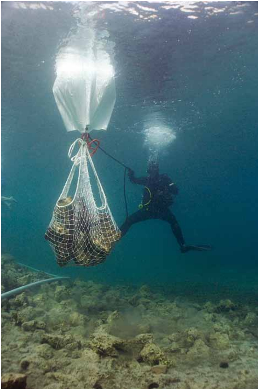
SL. 5. / FIG. 5.

Prenošenje kamena tijekom arheoloških istraživanja.