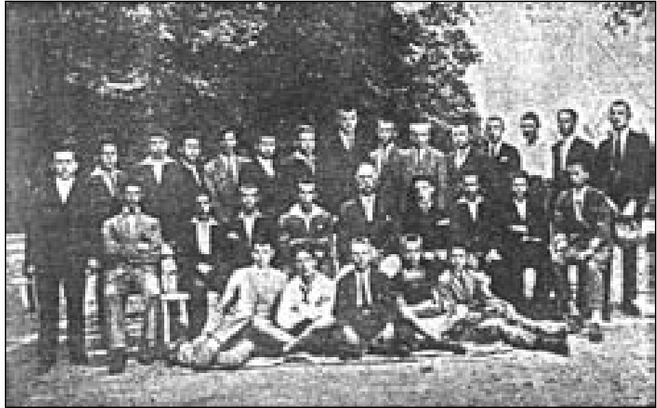
Sl. 5. Polaznici Radišine tekstilne škole u tvornici Milana Prpića u Oroslavlju 1927.