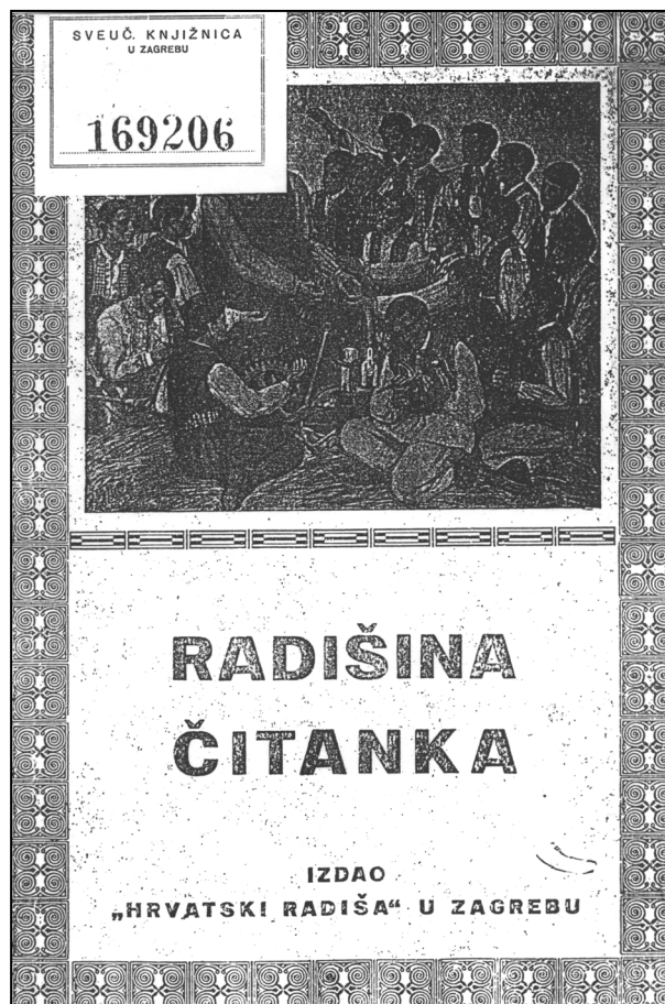
Sl. 3. Naslovna stranica Radišine čitanke iz 1940. s člancima koji su služili Radišnim pitomcima za pripremu

Rad senjske podružnice, ili bar povjereništva Hrvatskog radiše, može se pratiti do 1941.