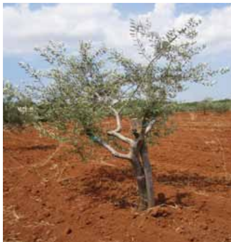
Slika 3. Istarska bjelica (a) i Buža (b) s hraniteljicama koje nisu prstenovane Figure 3. Istrian Bjelica (a) and Buža (b) with non-ringed feeders