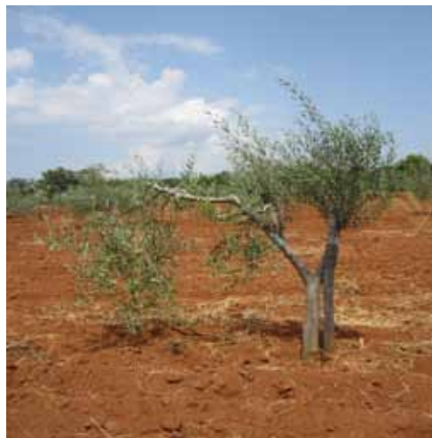
Slika 2. Istarska bjelica (a) i Buža (a) sa prstenovanim hraniteljicama Figure 2. Istrian Bjelica (a) and Buža (a) with ringed feeders