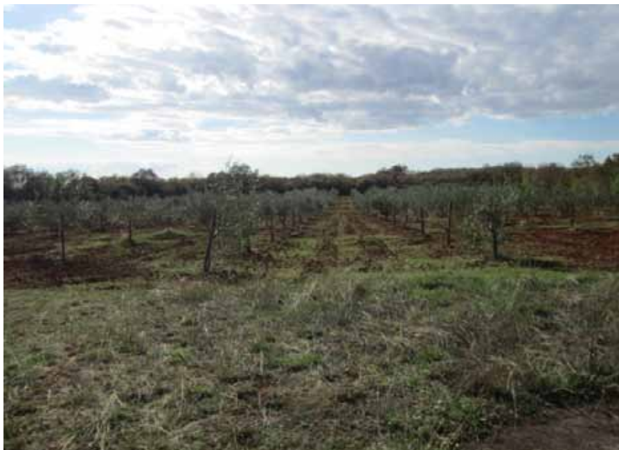
Slika 1. Maslinik u kojemu je obavljeno istraživanje

Maslinik u kojemu je obavljeno istraživanje nalazi se u blizini Zračne luke Pula, površine 1 ha. Nasad je podignut 2006. godine. Uzgojni oblik je polikonična vaza s razmakom sadnje 6 x 5 m. Sorta je Maurino uzgojena na vlastitom korijenu. Agrotehnički mjere u masliniku sastoje se od međuredne obrade tla, zaštite od bolesti i štetnika te gnojidbe tla. Tijekom vegetacije se obavlja u tri navrata plitka obrada tla, a za gnojidbu se koriste organska gnojiva.