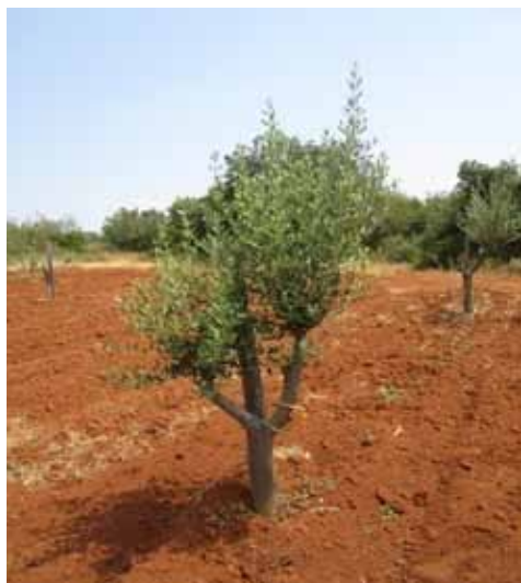
Slika 4. Pendolino (a) i Buža (b) bez hraniteljica Figure 4. Pendolino (a) and Buža (b) without feeders