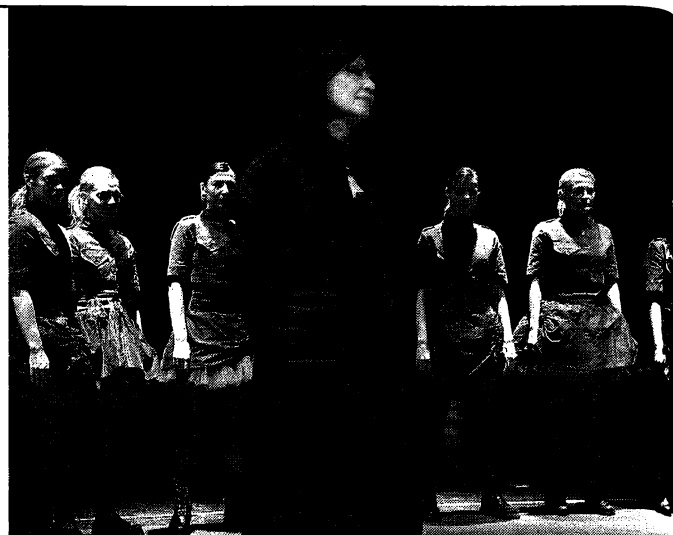
Sedmorica protiv Tebe

U mom konkretnom kazališnom radu najviše me uzbuđuje činjenica da dolazi do određenih uključenja i