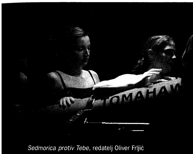
Sedmorica protiv Tebe, redatelj Oliver Frijić

Saša: Radom kao izvođač, a potom i kao dramaturg na plesnim predstavama, imao sam sreću jednostavno usvojiti neke tehnike korištenja tijela, osvješćivanja tjelesne prisutnosti izvođača pa sam posebno osjetljiv u tom polju rada. No, ne volim kad me ljudi percipiraju kao nekoga tko se isključivo bavi tijelom ili plesom u kazalištu. Ne znam, pokušavam balansirati na granici između poimanja tjelesnosti kao nositelja izvođačeve prisutnosti i njegove odsutnosti. Trenutačno me zanima rad na minimaliziranju izvođačeve geste, a povećanju učinkovitosti iste. Dakle, rekao bih da mi je interes vrlo formalne prirode.