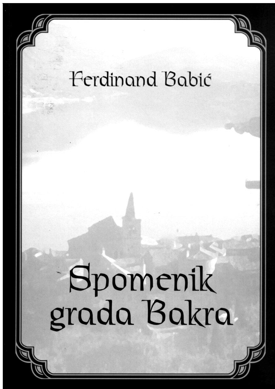
Sl. 2. Spomenik grada Bakra, Ferdinand Babić