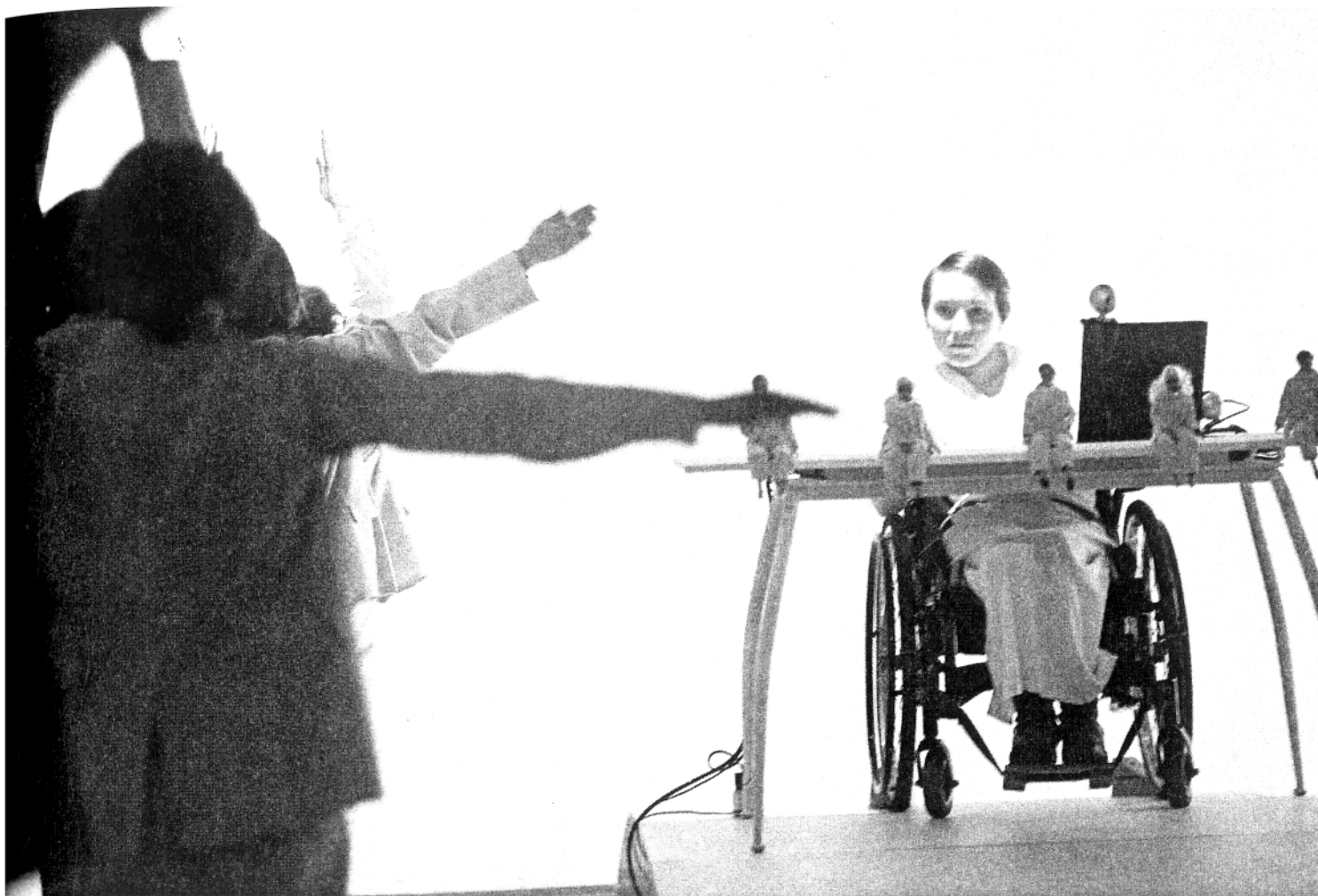
Priča o uspravnom čovjeku, režija Boris Jukananov

ma kvalitetnim pretpostavkama. Jedna je poznata već barem četrdesetak godina, otkad je ruski teatar ponovno počeo izlazak u svijet: riječ je o velikim redateljskim imenima koja se pojavljuju u pravilnim razmacima i onda dugo traju sa svojim originalnim estetikama iza kojih se iskazuje pravi redateljski genij. Druga je pretpostavka kvalitete izuzetan obrazovni sustav u kazališnim akademijama, visoka razina kazališnog obrazovanja i činjenica da gotovo svi spomenuti veliki redatelji imaju svoje majstorske radionice, zapravo alternativne akademije u kojima svoje znanje prenose mladim redateljima.