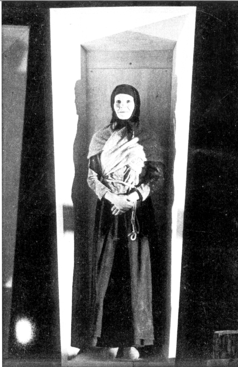
Rotschildova violina , režija Kama Ginkas

No, program Zlatne maske , a onda i Russian Casea , ipak je bio usredotočen na mladu gardu i one koji polako počinju biti titulirani srednjom generacijom. Uz već spomenutoga Morfova predstavili su se i Jurij Butusov, najzanimljiviji izdanak petrogradske redateljske škole, Rikardom III. , te Boris Jukananov, učenik Vasiljeva s multimedijalnom Pričom o uspravnom čovjeku u čijem je središtu jedna od najzanimljivijih osobnosti suvremene ruske scene, hendikepirana spisateljica i glumica Oksana Velikolug. No, definitivno redatelj iz mlade generacije koji je u nekoliko posljednjih godina stvorio niz zanimljivih produkcija jest Kiril Serebrennikov iz Rostova na Donu, koji je uspješnu moskovsku karijeru započeo prije pet godina Plastelinom , velikim međunarodnim uspjehom. Ove godine Serebrennikov je imao dvije predstave u konkurenciji za nagrade: Malograđani Gorkoga skinuli su s klasika ideološko opterećenje koje su mu nametnule sovjetske godine otvorivši nova značenja nepoznata ovoj generaciji ruskih gledatelja. Posebnu je pozornost izazvala produkcija Igranje žrtve po drami braće Presnjakov, a u režiji Serebrennikova. Vladimir i Oleg