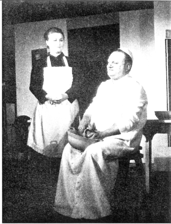
J. Bethengourt, DAN KADA JE KIDNAPIRAN PAPA , redatelj D.Puhovski, 1979.

I dok kazališta koja su profesionalni status imala 1945. godine, isto kao i ovo virovitičko, dakle Požega, Vinkovci, Zadar, Pula, Karlovac, Šibenik i druga, tek pokušavaju obnoviti svoju scenu, stvoriti ansambl, publiku, program..., kazalište u Virovitici obilježava šezdeset godina neprekinutog rada. Zasluga je to generacija kazališnih promotora, kreatora, zaljubljenika, Virovitičana koji su ga ne samo održali na životu u svim burnim i za kazalište i kulturu možda nepopularnim vremenima nego su ga uspjeli osnažiti, podići i izdići čak i iznad mnogih profesionalnih kazališnih kuća koje sve te godine žive na državnim dotacijama.