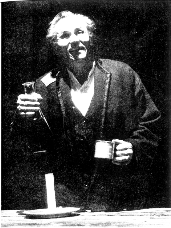
I. Bakmez, JAHAČI APOKALIPSE , redatelj M.Sršen, 1982.