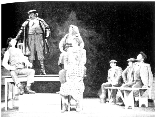
I. Brešan, PREDSTAVA HAMLETA U SELU MRDUŠA DONJA , redatelj D. Ferenčina, 2002.