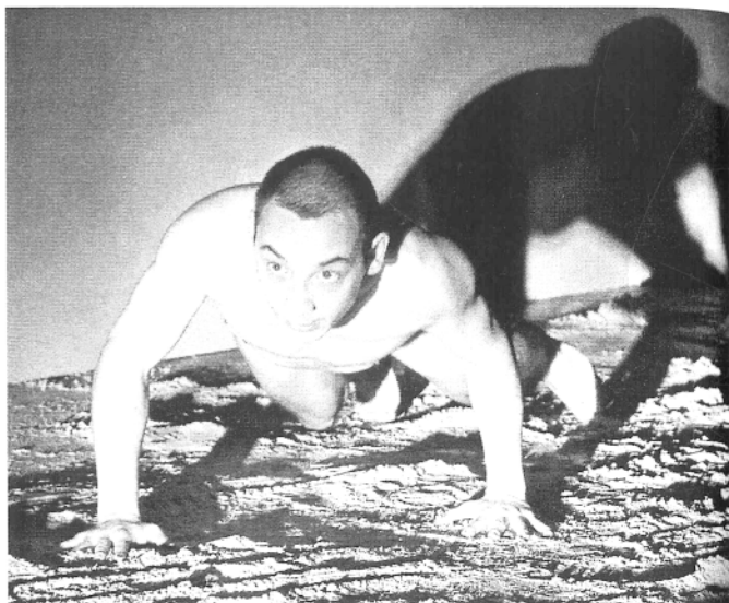
Nicky Silver: Debeli muškarci u suknjicama , SNG Maribor, režija Samo S. Strelec, Tadej Toš

Zajednički nazivnik većine predstava (neke su već spomenute kao Baltimorski valcer , Debeli muškarci u suknjicama i Naš grad ) na festivalu bio je element fantazmagoričnosti pojavljujući se u različitim oblicima, ali