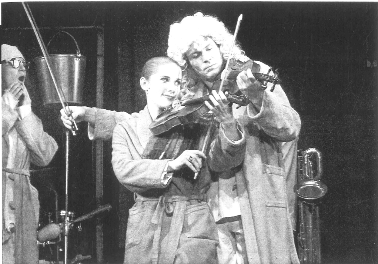
Peter Weiss: Marat i markiz de Sade , Teatar na Taganki, Moskva, režija Jurij Ljubimov