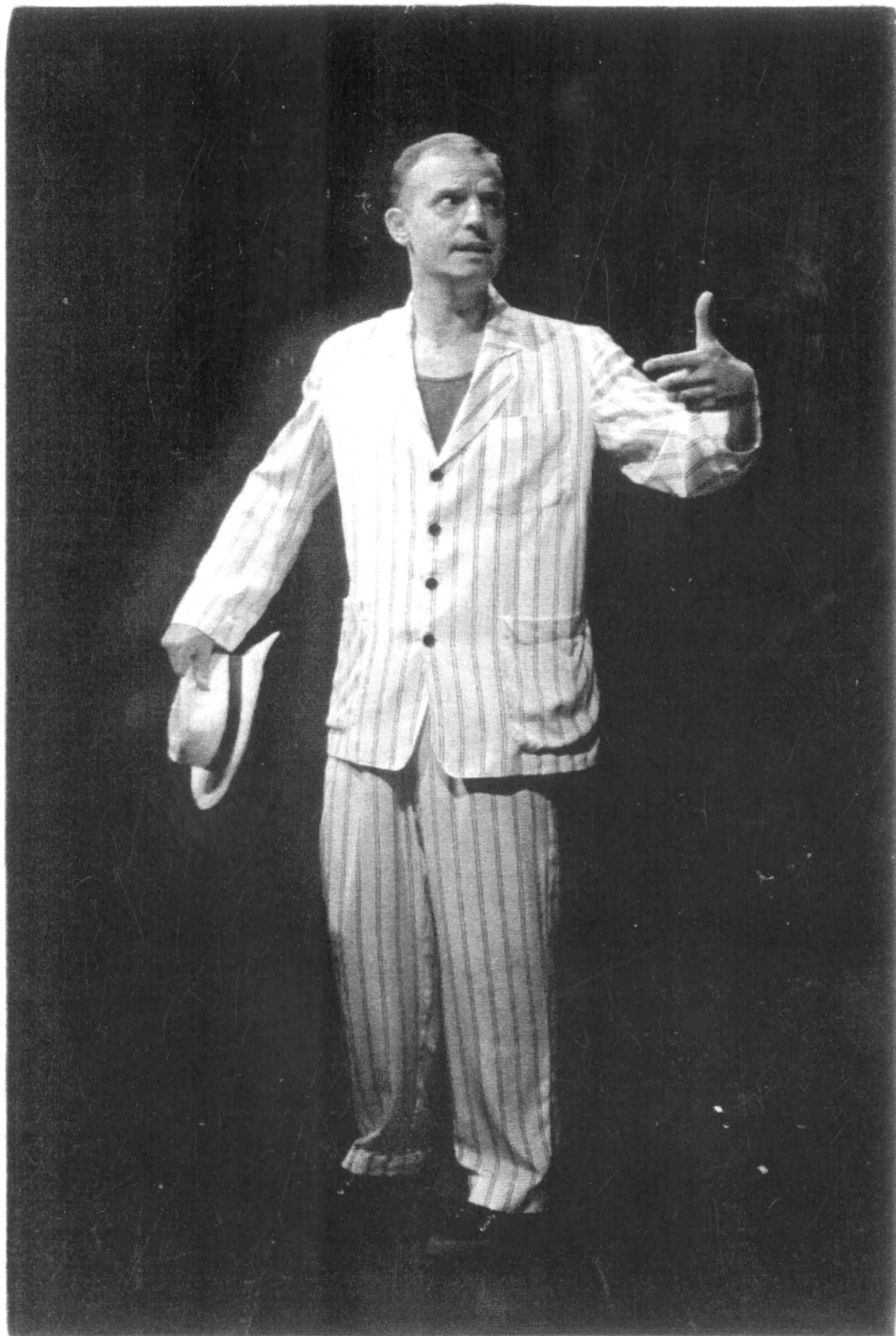
Ignatije Iljić Špigeljki – I. S. Turgenjev, Mjesec dana na selu , Dramsko kazalište "Gavella"