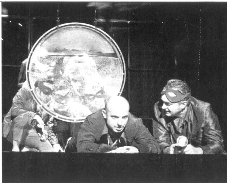
Don Juan – M. Frisch, Don Juan ili ljubav prema geometriji , HNK Zagreb, 2003.

Mislim da imam talenta za taj posao. Ništa drugo ne bih mogao raditi tako dobro, pokazati svoju osob-