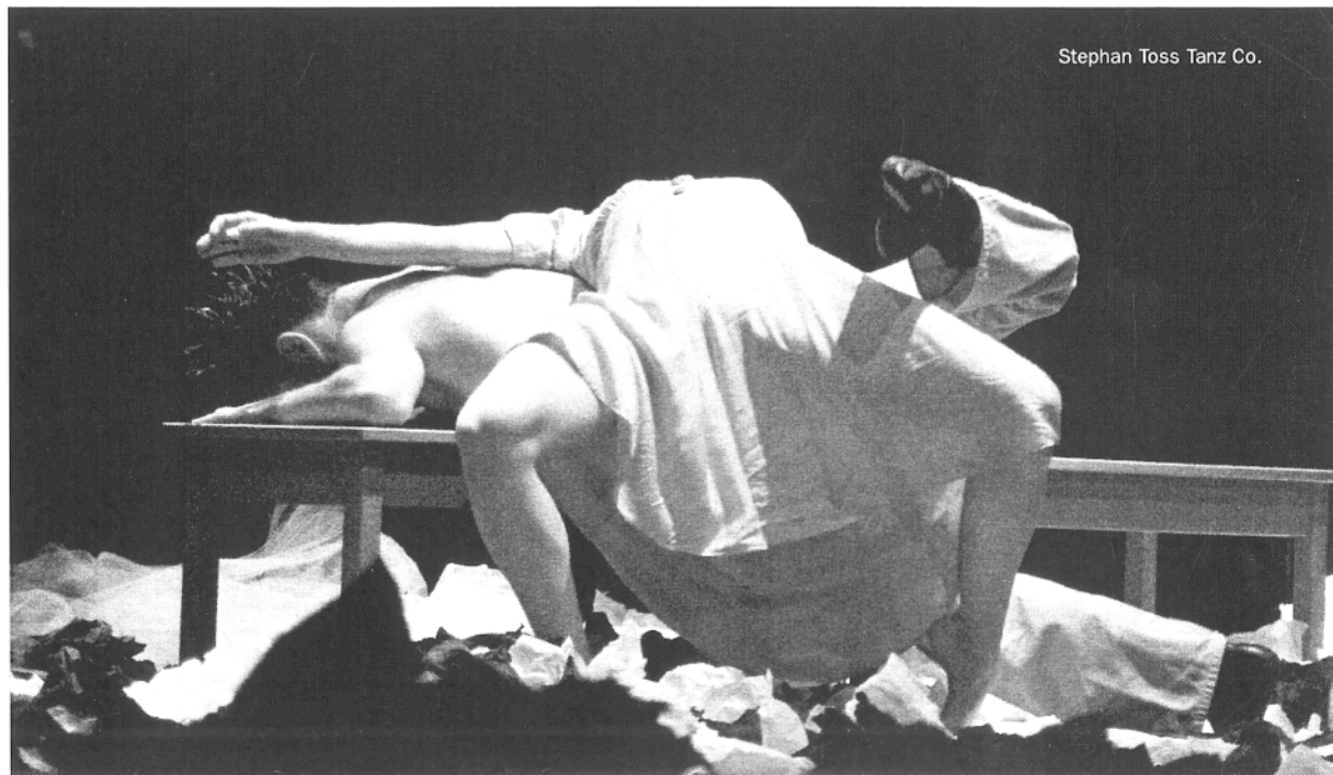
Stephan Toss Tanz Co.