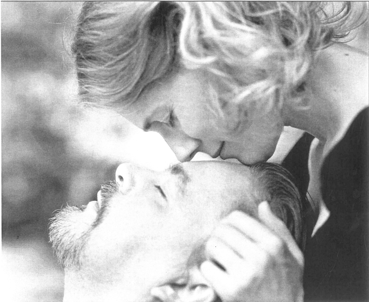
Jon Fosse, Netko će doći , režija Eirik Stubo, Riksteatern

Skandinavci: tri izabrane predstave otkazale su sudjelovanje na bijenalu, nisu doputovale jer su pozvane na druge međunarodne festivale. Riječ je baš o kazalištima koja su u skandinavskom vrhu i po organizaciji i po dotacijama, pa im nacionalni festival i nije dovoljno velik zalogaj, ali je zato selekcija bila osiromašena. Kraljevsko dramsko kazalište s Andromahom Matsa Eka, Židovski teatar s produkcijom Kristalvagen i Vastana kazalište sa Sagom o Gōsti Berlingu nisu bili u Uppsali.