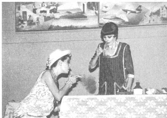
M. Begović, Amerikanska jahta u splitskoj luci , HNK Zagreb