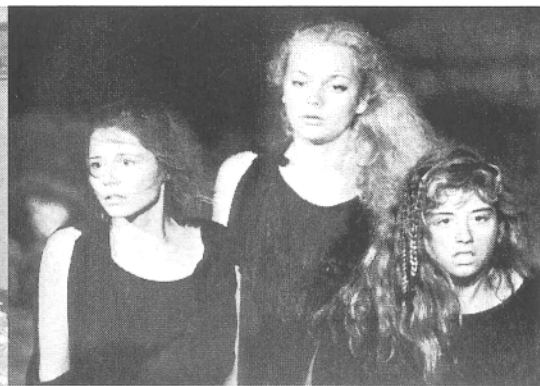
Hekuba , Dubrovačke ljetne igre

pojavio u Puli, na festivalu hrvatskoga filma u službenoj konkurenciji. Film je osvojio pulski festival.