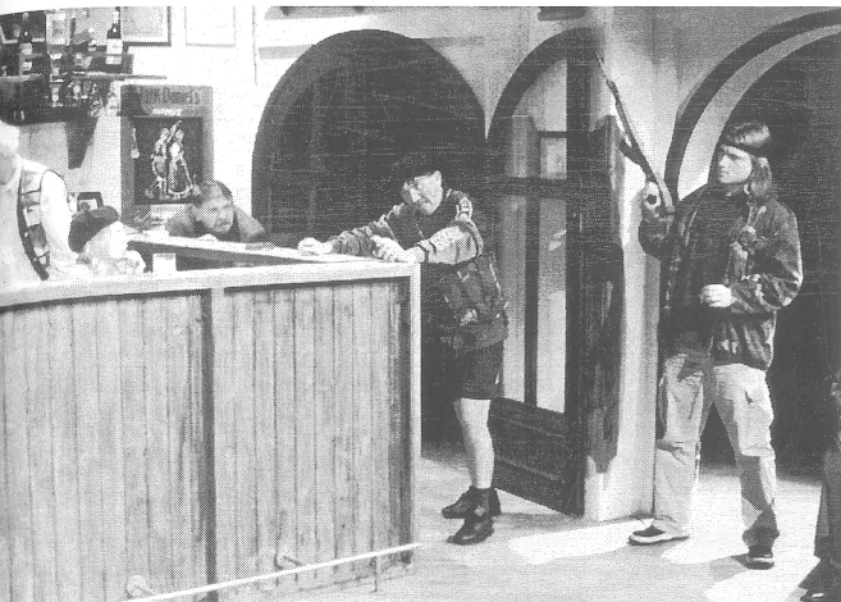
Libertina I epizoda Titanic , završna scena