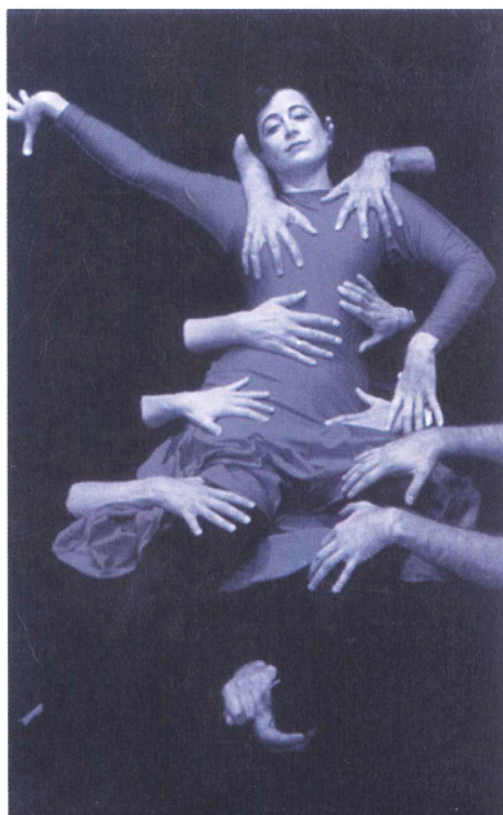
OPERA NA NOVI NAČIN SHAMELESS GRUPE OPERA CIRCUS

U svom hotelu (The Point Hotel) mogla sam birati između kontinentalnog i engleskog doručka. Zbog mirisa pečenih jaja, šunke, i tosta ovom drugom nisam mogla odoljeti. Uzimala sam čak i smežurane ali ukusne gljive, a od ponude engleskog doručka uspjela sam odoljeti jedino kuhanoj rajčici koja je izgledala kao ustupak zdrave hrane ostaloj ponudi. Dobro, odoljela sam svim mješima, kompotima, putrićima i medicima iz kontinentalne ponude, ali sam ipak ujutro jela kao lučki radnik - količinu mog uobičajenog jednog i pol ručka nakon čega nisam bila gladna cijeli dan. To je bilo praktično zbog neprestanog trčanja tijekom kojeg ne bih ni stizala jesti, ali sam zbog toga propustila uobičajene ulične specijalitete. Posljednji dan sam se ipak odvažila da u jednom od mnogobrojnih malih uličnih "restorana" škotskih specijaliteta (kao fish&chips, pohane krvavice, mljevene riblje okruglice...) kušam jedan koji mi je suputnik u avionu strašno hvalio - hagis . Vrlo je ukusan, ali mu opis sastojaka