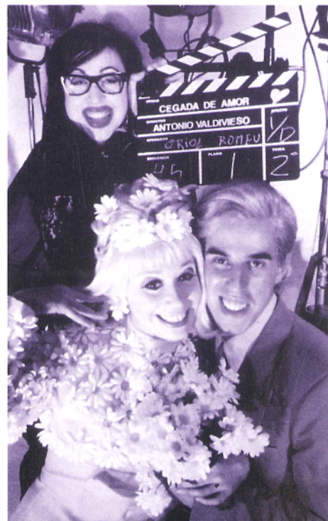
KIČ ZA HIT: LA CUBANA BLINDED BY LOVE

Drugi oblik informiranja o tome što vidjeti su novine. Količina tiskanog materijala koji prati festival nama je šokantna - uz doslovno tonu propagandnog materijala pojedinih predstava koji se dijeli, ima nekoliko posebnih novina koje izlistaju čitav program festivala. Festivalska događanja imaju,