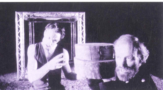
VELŠKI KRIK I BIJES - GRUPA VOLCANO

Drugo atraktivno gostovanje: Nakon velikog uspjeha Čehovljeva Ujka Vanje u režiji Petera Steina na festivalu prošle godine, ove godine se mogao vidjeti nastavak Stein-Čehov produkcije - Višnjik . Ova njemačka produkcija je velika - doslovno, jer je na velikoj sceni, čije širine prodiru i u publiku, velik ansambl od tridesetak ljudi - ali i preneseno, jer je uspješno stvorila svijet Čehovljevih junaka. Naravno, uz redateljsku