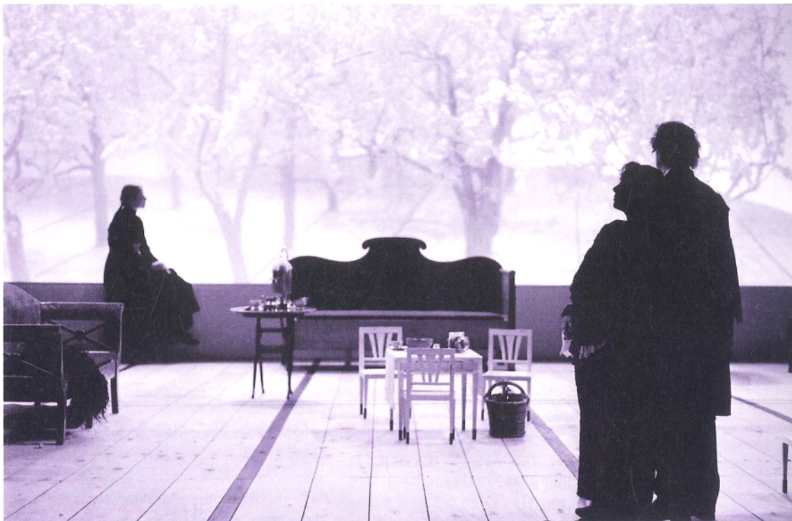
ČEHOVLJEV VIŠNJIK U REŽIJI PETERA STEINA

Ove godine izvedba te predstave naručena je u kratkom roku od Royal Lyceum Theatrea, kazališne kuće sa statusom edinburškog HNK. Izvedena je solidno, ništa više. No, to je bilo puno više od druge produkcije, Shakespeareove Mjere za mjeru u izvedbi Nottingham Playhousea koja je i stilski i glumački neujednačena i razvučena.