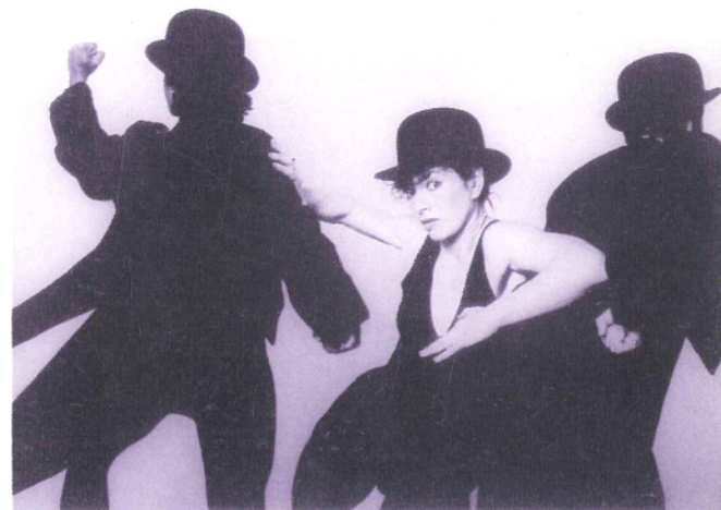
GRUPA THE KOSH

Najzanimljivije su bile linije teatra pokreta: vrlo poetična plesna predstava Stung koja se odvija u zraku na rubu krhke