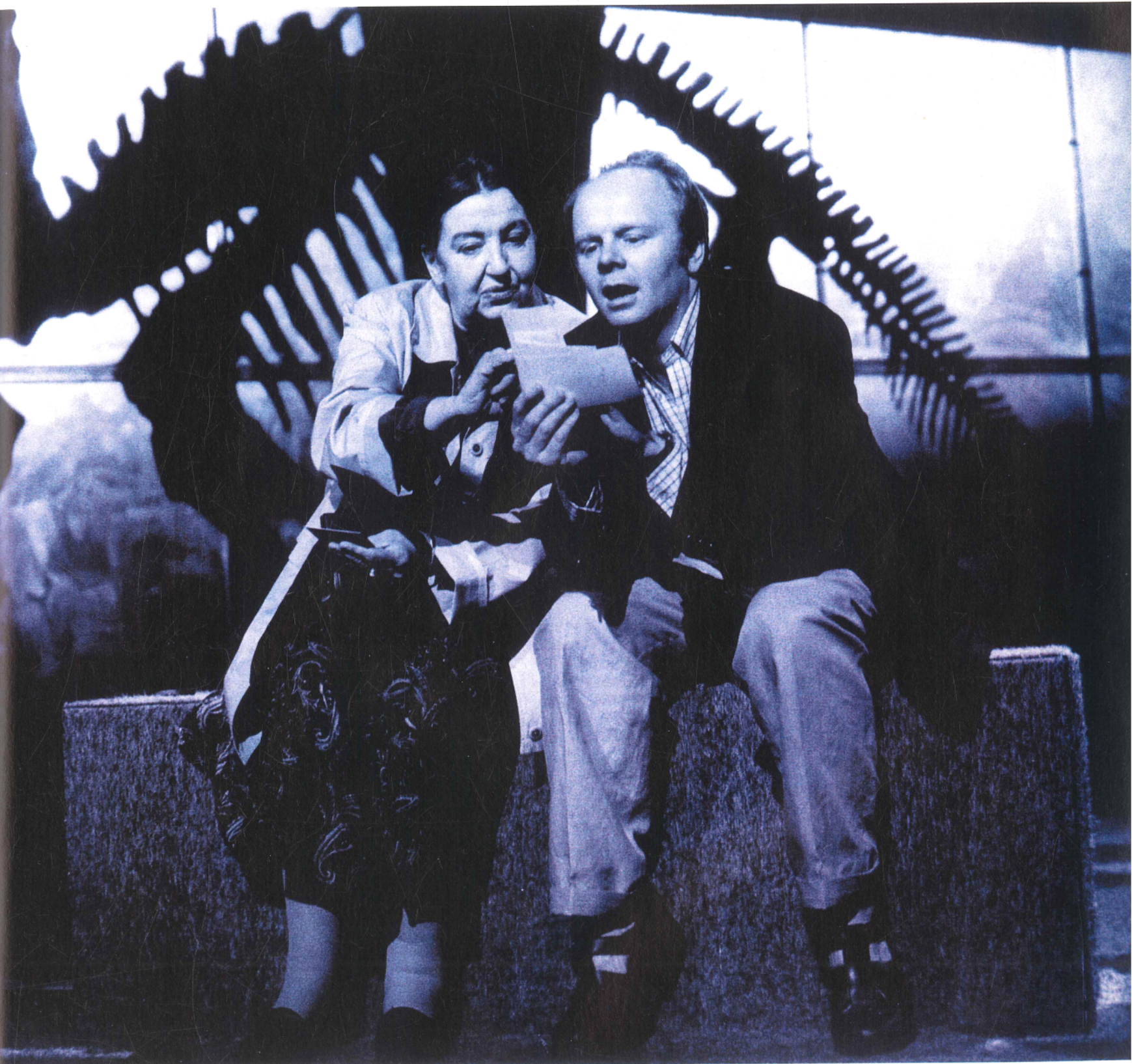
CARYL CHURCHILL, BRAVE HEART