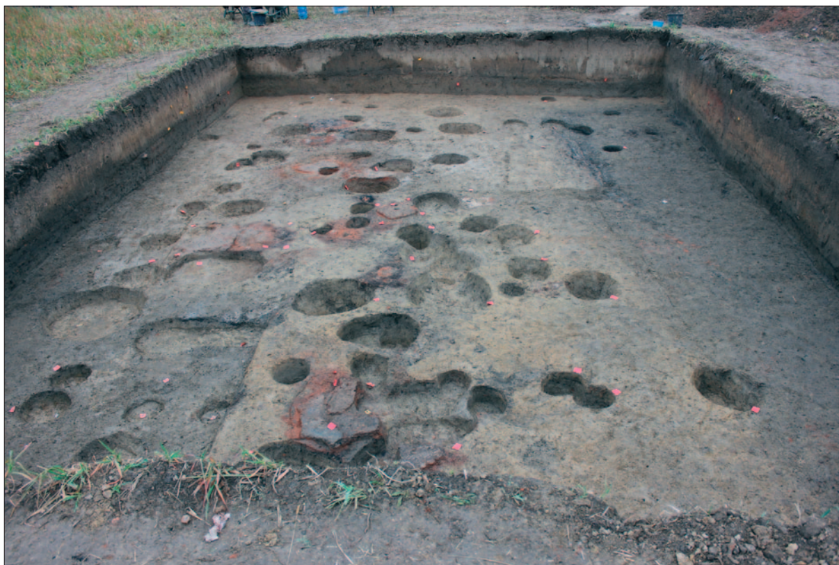
Sl. 6 Podnica kuće SJ 350 u južnom dijelu i sloj SJ 306 u sjevernom dijelu sonde

Fig. 5 Explored 8th horizon with smaller oval pits in line southeast–northwest