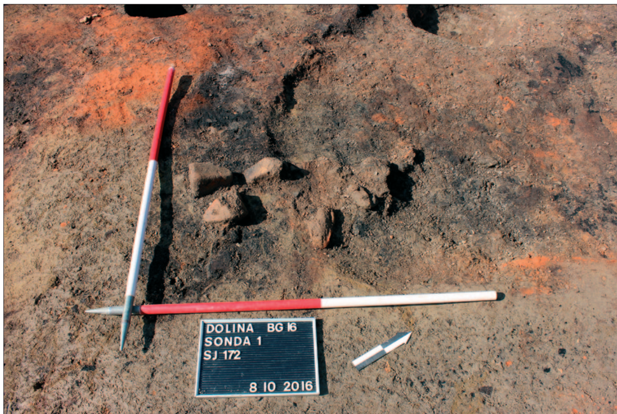
Sl. 3 Ostaci tkalačkoga stana in situ u jugoistočnom uglu kuće

Fig. 3 Remains of loom weights in situ in southeastern house corner