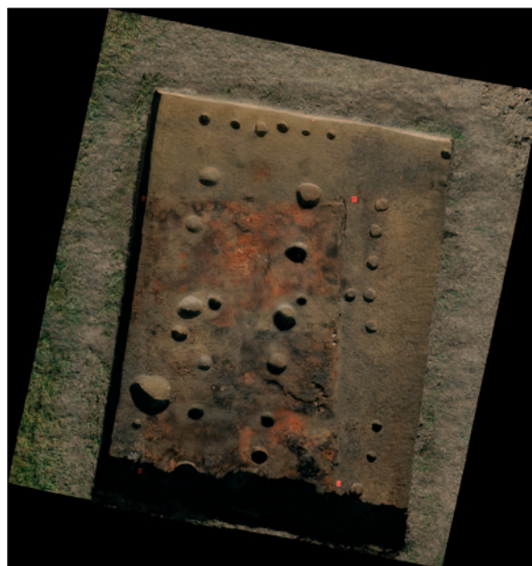
Sl. 2 Zračni snimak kuće SJ 172

Nakon iskopa SJ 170 i SJ 172, izdvojen je niz manjih ovalnih jama u smjeru sjever – jug koji su vjerojatno bili vezani uz neku veću konstrukciju koja se prostirala prema zapadu (sl. 5). Ispod SJ 170 i SJ 172 u južnom dijelu sonde nalazi se sloj od žute zemlje kojim je nivelinirana površina za ognjište SJ 280. Ispod ognjišta SJ 280