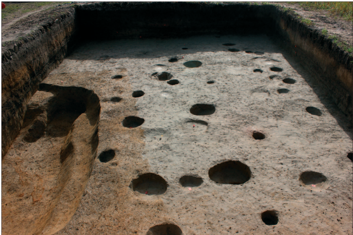
Sl. 7 Istražena sonda 1

Bogata stratigrafija sonde 1 na kasnobrončanodobnom naselju Babine Grede u Dolini svjedoči o strateškoj važnosti prirodno uzdignute grede položene uz rijeku na kojoj su se odvijale intenzivne naseobinske aktivnosti tijekom 11. i 10. st. pr. Kr. Uzdignuti položaj bio je mjesto na kojem su se stanovnici naseljavali sigurni od hirovite rijeke uz koju su živjeli, zbog čega je ostala sačuvana stratigrafija brojnih aktivnosti u kratkom razdoblju od 100 do 150 godina prema tipološkoj analizi nalaza, a što će biti provjereno i radiokarbonskim datiranjem.