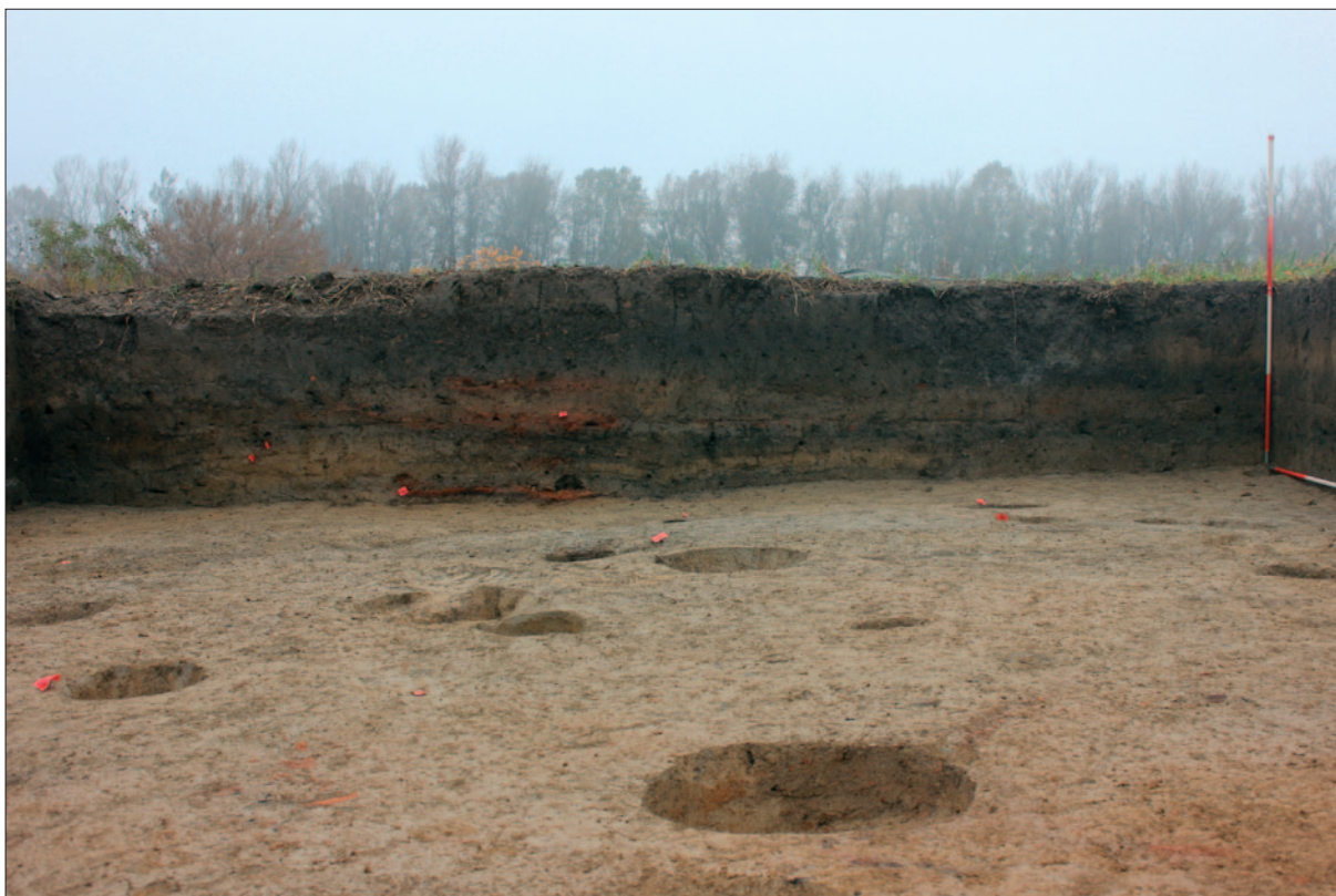
Sl. 8 Južni profil sonde 1