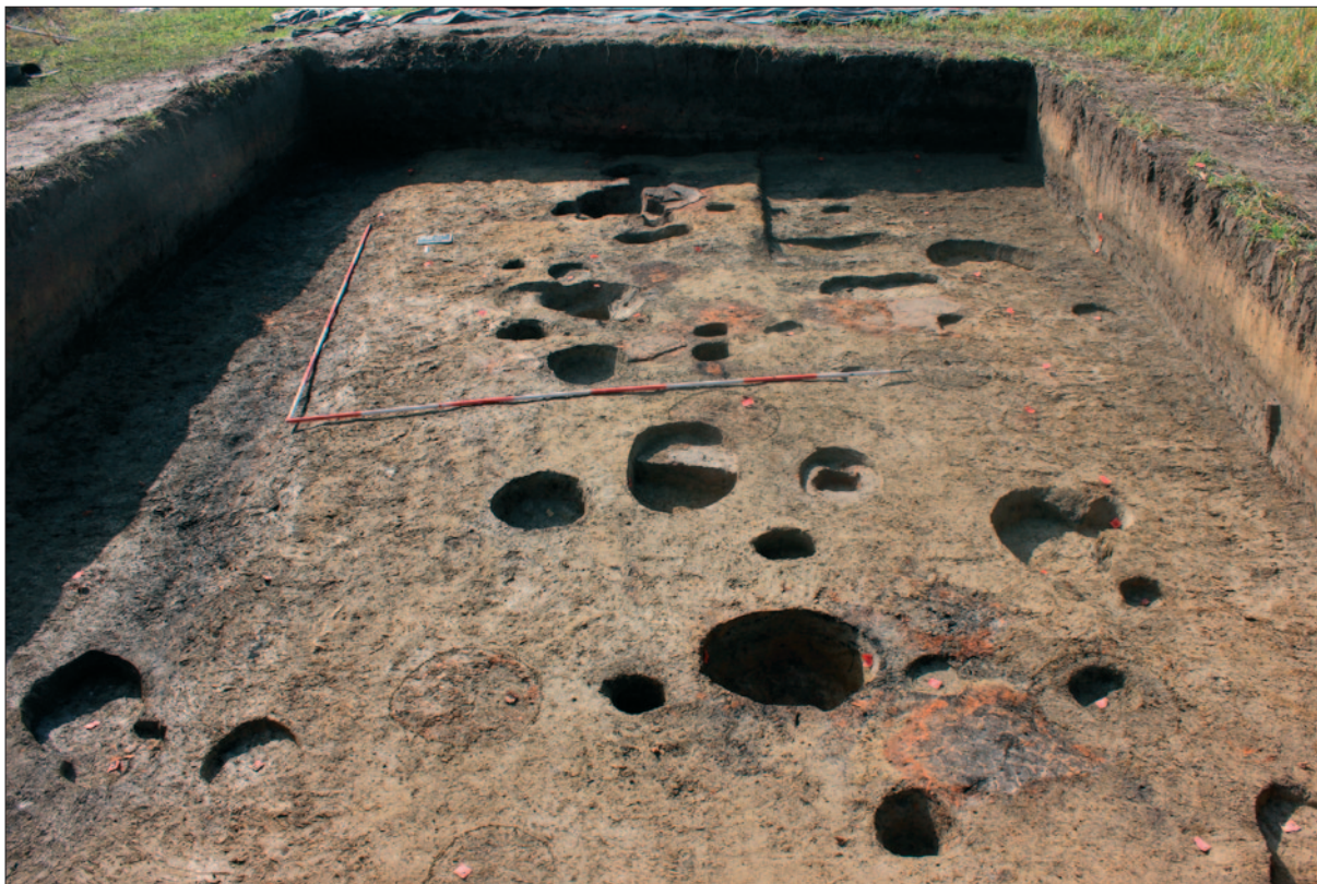
Sl. 5 Istraženi 8. horizont s manjim ovalnim jamama koje su u nizu jugoistok – sjeverozapad

Fig. 5 Explored 8th horizon with smaller oval pits in line southeast–northwest