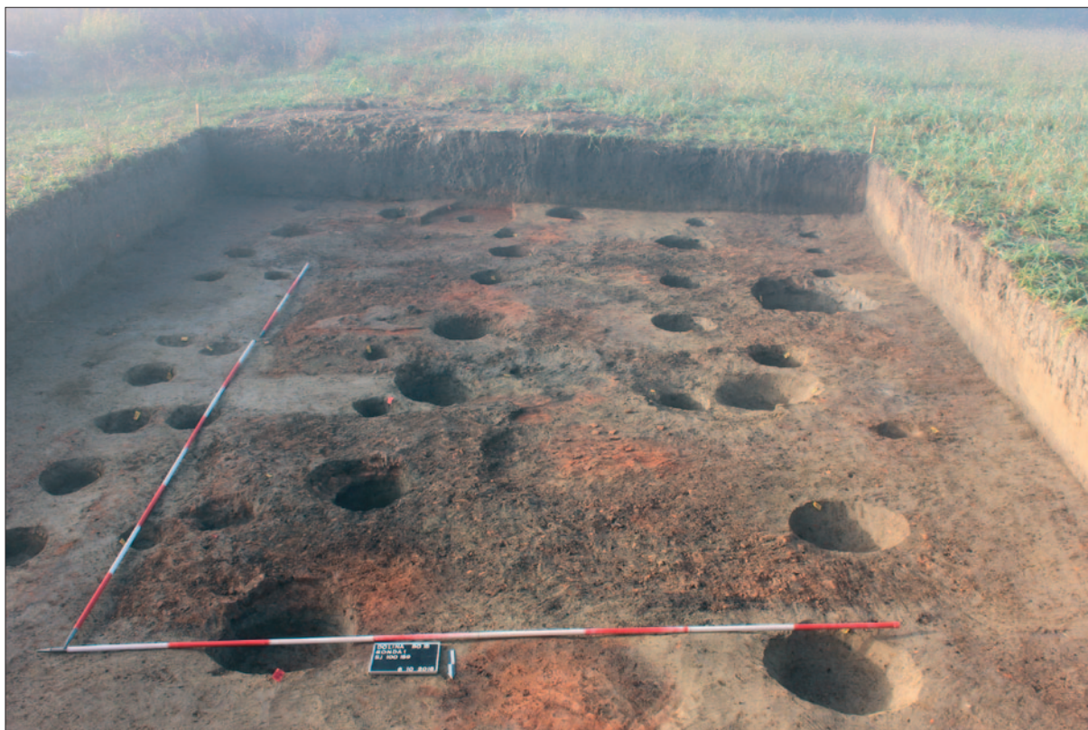
Sl. 1 Urušenja zidova SJ 100, 159 te slojevi 168, 169, 171

Fig. 1 Collapsed walls SU 100, 159 and layers 168, 169, 171