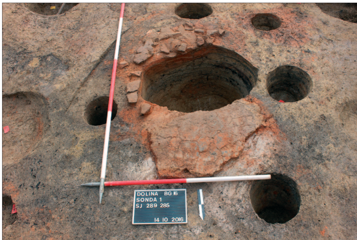
Sl. 4 Ognjište SJ 285 presječeno jamom SJ 285

Fig. 3 Remains of loom weights in situ in southeastern house corner