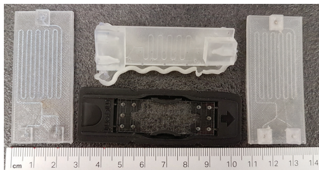
Slika 1 – Komercijalni stakleni mikroreaktor tvrtke Micronit te tri mikroreaktora izrađena aditivnim postupcima izrade

Zbog malih promjera kanala, strujanje kapljevine u mikroreaktorima je laminarno (vrijednosti Re kreću se od 1