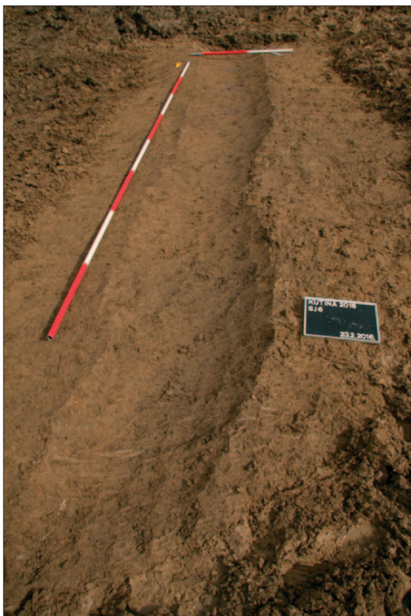
Sl. 1 Ukop kanala SJ 6

Fig. 1 Remains of channel SJ 6