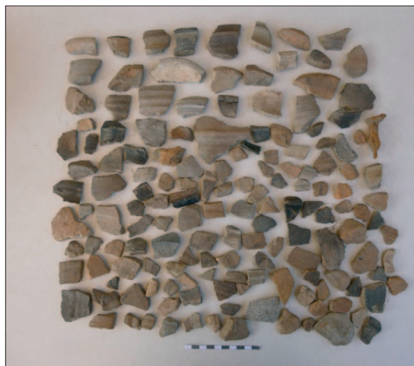
Sl. 2 Srednjovjekovna keramika s površine i iz humusnog sloja

Fig. 1 Remains of channel SJ 6