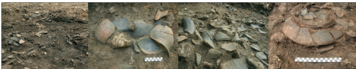
Sl. 1 Ostaci peći, ognjišta, keramičkih posuda i skupina predmeta in situ

Fig. 1 The remains of the furnace, the hearth, ceramics and the group of items in situ