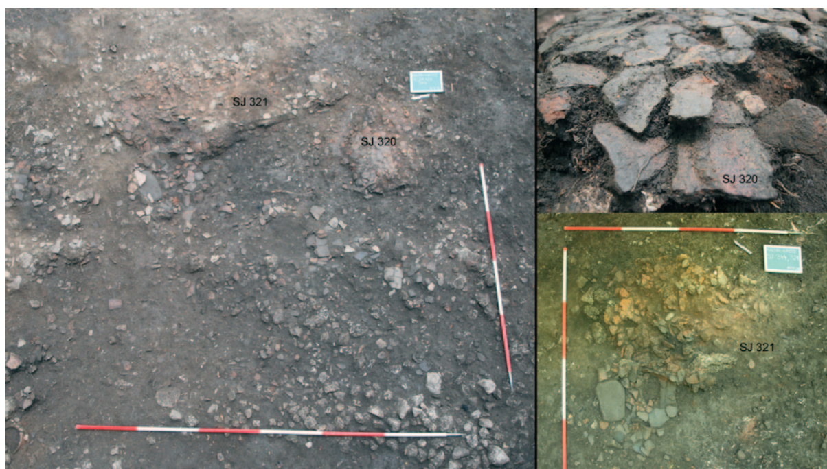
Sl. 2 Ostaci peći (SJ 321), ognjišta (SJ 320) i slojevi s velikom količinom razbijenih keramičkih posuda

je rastavljena tako da je podijeljena u četiri zone/kvadranta, a dijelovi urušenja peći dokumentirani su u nekoliko slojeva. Na središnjem dijelu urušenja nalazila se cjelovita plitka zdjela promjera 30-cm u kojoj se nalazila zdjela S profiliranog tijela s trakastom ručkom. Na urušenju strukture peći pronađeni su i raznoliki predmeti poput keramičkih pršljenova te koštani i kameni predmeti. U južnom dijelu sonde, južno od navedenih slojeva te ispod suhozidne strukture (SJ 323) koja je dokumentirana protekle sezone, pružala se u smjeru zapad – istok, otkriven je sloj urušenja sastavljen od kamena srednje veličine određen stratigrafskom jedinicom 332. Ispod tog urušenja otkrivena je vrlo dobro očuvana suhozidna struktura (SJ 335) s malim otklonom u odnosu na orijentaciju SJ 323. Suhozid (SJ 335) je bio sastavljen od većeg, pravilno slagano kamena prosječnih dimenzija 15 x 20 x 10 cm u dužini od 2 m i prosječnoj širini 0,50 m i zalazio je pod zapadni profil. Uz sjevernu stranu strukture neposredno uz kamenje nalazili su se ostaci lijepa koji su pratili smjer pružanja suhozidne strukture SJ 335 čitavom dužinom, dok je s njegove sjeverne strane dokumentiran i plitki ukop (SJ 336/337). Ostaci strukture interpretirani su kao potporni zid terase. Južno od navedenih struktura sastavljenih od kamena nalazio se sloj (SJ 329) s ulomcima keramike i sitnog kamena, a ispod njega otkriveni su ostaci prostora omeđenog pravokutnom strukturom