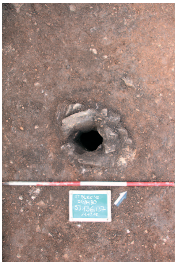
Sl. 1 Rupa za stup SJ 136–137