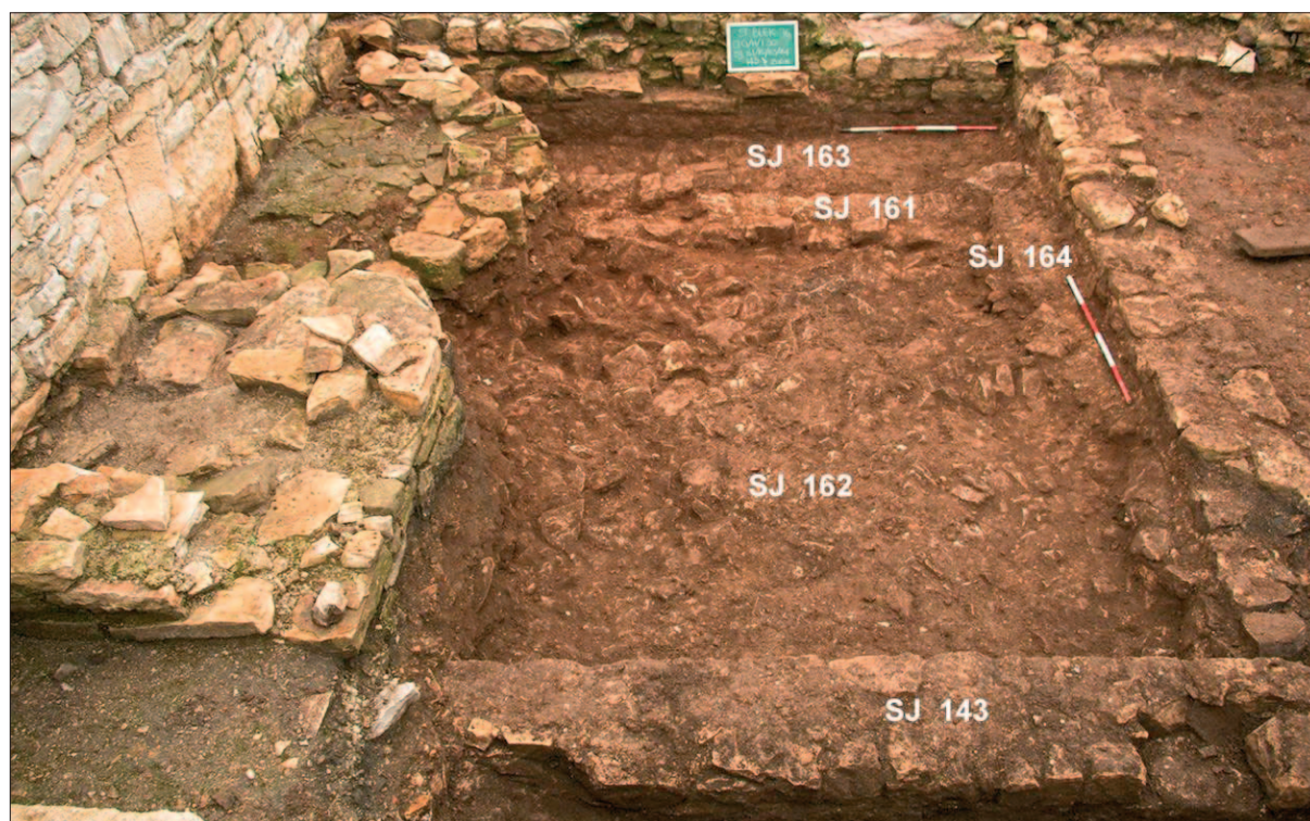
Sl. 2 Stratigrafska situacija u zapadnom dijelu P8 nakon uklanjanja zida SJ 059: zidovi SJ 143 i 161, slojevi urušenja SJ 162 i 163, temelj zida SJ 164 (snimila i izradila: A. Konestra)

Južno od zida SJ 075 (Šiljeg et al. 2016: 140, sl. 2) radovi su se ograničili na čišćenje zatečenih slojeva i njihovu precizniju definiciju, no započeto je i uklanjanje SJ 076. Nažalost, zbog kiše, nije bilo moguće nastaviti s radom. Uz SJ 056, južno od SJ 075 pa sve do zida SJ 078 i sloja žbuke SJ 085 ustanovljen je sloj urušenja s većim kamenjem (SJ 149) koji se nalazi iznad SJ 076, a sličan je sloju urušenja ustanovljenog i na zapadu iznad SJ 077 (SJ 152) (sl. 4). Uz zapadni dio SJ 075 ispražnjena je zapuna SJ 083 te je definiran njezin ukop SJ 151. Ustanovljeno je kako je ovaj ukop presjekao SJ 075 i 076.