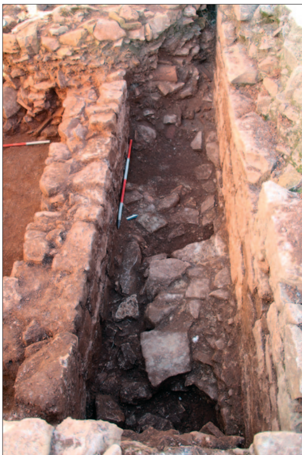
Sl. 3 Sloj SJ 174 između zida SJ 161 i cisterne

Fig. 3 Layer SU 174 between the wall SU 161 and the cistern