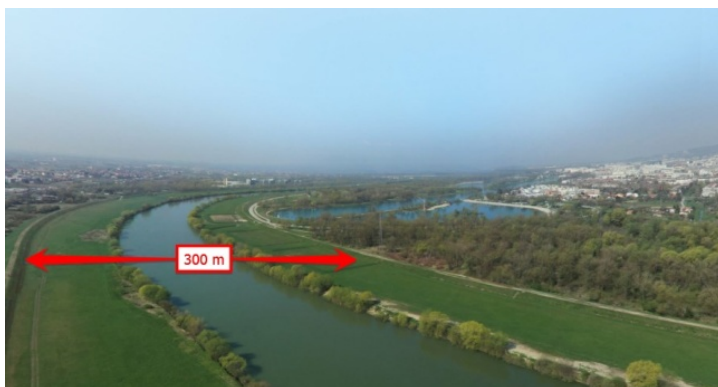
Slika 2. Prikaz obrambenih nasipa uz Savu kroz gradsko područje

području Zagreba izdržao je vodeni val, ali okolna područja (Velika Gorica, Zaprešić, Samobor) bila su velikim dijelom pogođena. Od velikih voda Save primjereno je zaštićen samo Grad Zagreb koji je, prema procjenama, siguran od 1000-godišnjih velikih voda. Ostala područja uz Savu uglavnom su nedovoljno zaštićena. Uzvodno od Zagreba prema slovenskoj granici obrambeni nasipi samo su dijelom izgrađeni, pa su niže ležeći dijelovi nekoliko naselja šire zaprešićke i samoborske regije učestalo plavljeni.