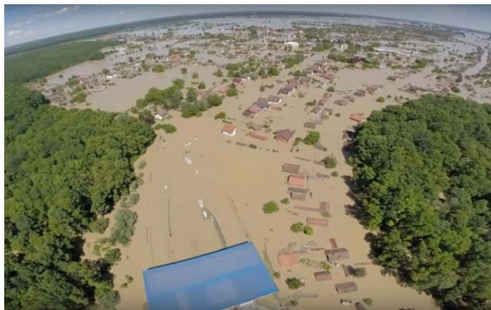
Slika 4. Dio poplavljenog područja u Vukovarsko-srijemskoj županiji

2014. godini. Tada su najviše bile pogođene općine Gunja, Drenovci i Vrbanja. Ugroza je bila na dužini od 67 kilometara uzrokovana najvećim vodenim valom u tisućljetnom prosjeku od 1194 centimetara te se razvila u vrlo kratkom periodu. Dio poplavljenog područja prikazan je na slici 4.