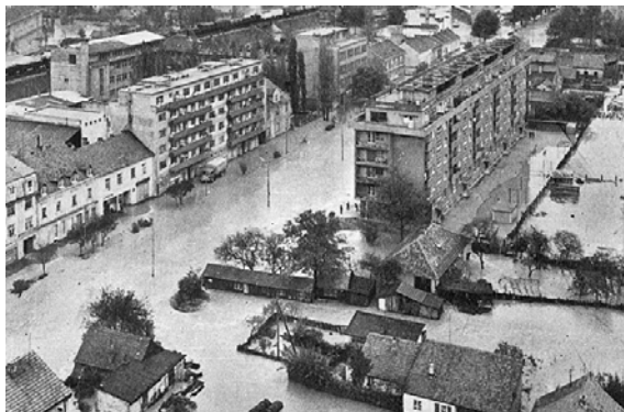
Slika 1. Poplavljeno područje centra grada u osi Savske ceste 4

Zagreba usječen u nataložene šljunčane slojeve koji stalnim kretanjem krupnog nanosa uzrokuju česte migracije korita i time stvaraju specifične geološke uvjete, u sklopu regulacije trebalo je zasuti stare rukavce. (SlukanAltić, 2010.). Od završetka Drugog svjetskog rata, regulacija koja je bila realizirana uspjela je potaknuti intenzivnu urbanizaciju dijelova područja između Save i željezničke pruge i naočigled je pružala rješenje za sigurno daljnje širenje (iako su bila prisutna pojavljivanja plavljenja zaobalja), sve do katastrofalne poplave 1964. godine. Razlog te, do sada najveće poplave na području grada Zagreba koja se desila u noći s 25. na 26. listopada, bio je pucanje postojećeg nasipa. Nabujala rijeka Sava poplavila je trećinu Zagreba, a voda je prekrila više od 6000 hektara užeg gradskog područja na kojemu je živjelo više od 180 000 stanovnika. Razmjere poplave prikazane su na slici 1. koja prikazuje područje u osi Savske ceste.