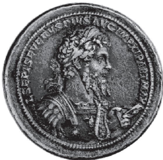
Slika II.a 8