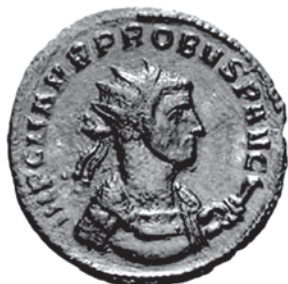
Ticinum Tip 1.