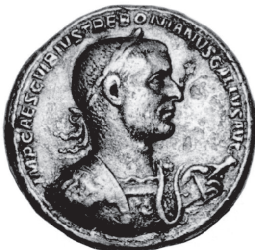
Slika II.b 9