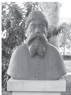
Biskup Šimun Kožičić Benja

Rijeka je oduvijek bila važno kulturno središte u kojem se zrcalila hrvatska baština. U prilog tome ide podatak da u razdoblju od 1530. do 1531. godine u Rijeci djeluje glagoljska tiskara koju je osnovao biskup Šimun Kožičić Benja. Tijekom dvije godine u njoj je tiskano pet knjiga na glagoljici i hrvatskom jeziku.