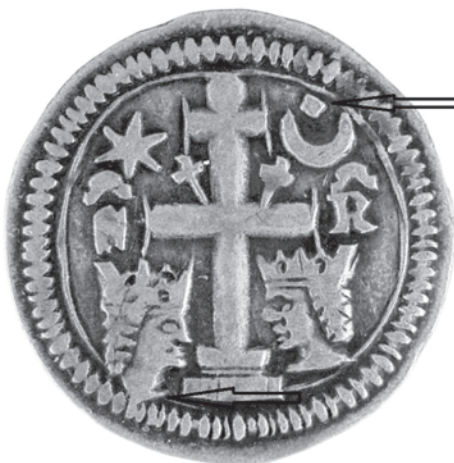
Slika 5. rv.

Slika 5. prikazuje denar na čijem je licu tekst legende izrezan vrlo nemušto, s mnogo deformacija slova u odnosu na tipizirane primjerke. Slova M i R nemaju tipičan izgled. Slovo S izrađeno je gotovo neprepoznatljivo. I na naličju te kovanice vide se neke netipičnosti. Takva je oznaka unutar polumjeseca, koja izgleda više kao kvadrat nego kao kružić. Lijeva glava pod prečkom križa smještena je prenisko pa dodiruje vanjski biserni krug, a vrh križa ima neuobičajen kružni završetak.