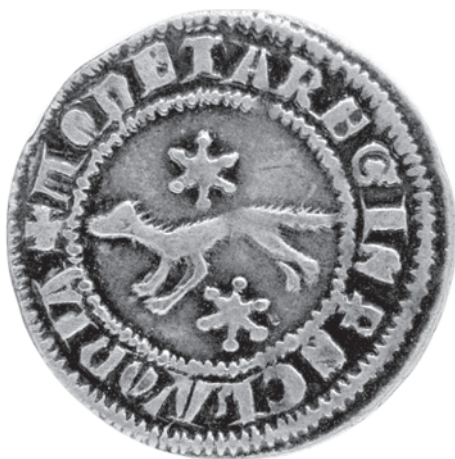
Slika 5. av.