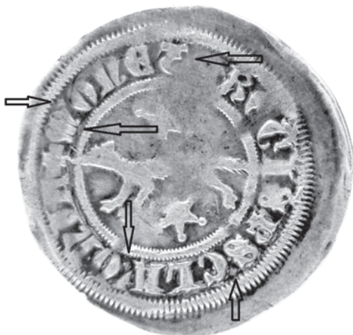
Slika 4. av.

Na dva primjerka koji nemaju opisane tipove slova postoje i drugi elementi po kojima su različiti.