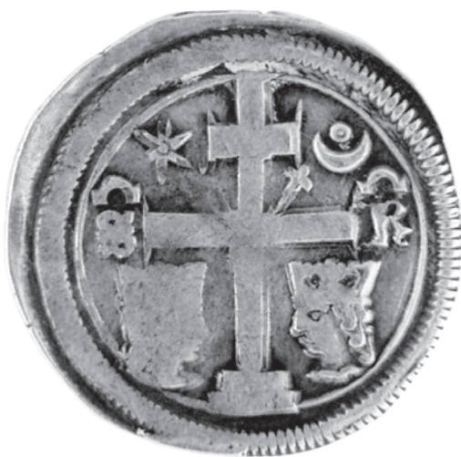
Slika 4. rv.

Slika 4. prikazuje primjerak Stjepanova denara na kojem se vidi velik broj odstupanja od dosad opisivanih obilježja. Osim tipa slova M koji je karakterističan za kasnije slavonske banske denare, vidi se i vrlo neuobičajeno slovo T koje svojim oblikom podsjeća na brojku 3 . Tu su i neobične kovničke oznake, koje se nalaze na netipičnim položajima, a koje su na slici označene strelicama.