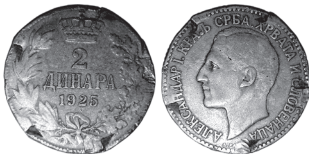
Slika 1. Prikaz krivotvorene dvodinarka iz 1925., HDA, SB ODZ, kut. br. 73, 39/1931., Kotarsko načelnništvo u Garešnici šalje primjerak krivotvorene dvodinarka Kr. Banskoj upravi u Zagrebu, 1. 6. 1931.