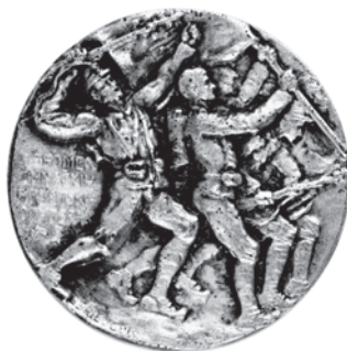
Slika 4. Značka U spomen junačkih hrvatskih domobrana

Istovjetan motiv i natpis nalazi se na znački (HPM/PMH – 10901, slika 4.) iz Zbirke odlikovanja, medalja, plaketa i značaka Hrvatskoga povijesnog muzeja, a kao godina izrade stavljena je 1916. bez ikakve sumnje. Značka je izrađena od pocinčanoga tombaka i promjera je 42 mm, s iglom za pričvršćivanje straga. 24 Do sada se mislilo da je ta značka vojna značka, odnosno da ju je dala izraditi vojna postrojba ili vojna institucija za svoje pripadnike. 25 Ali rasvjetljavanje podataka o pokretaču njezine izrade svrstava je u red domoljubnih značaka namijenjenih svima, unatoč tome što prikazuje vojnu domobransku postrojbu.