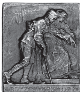
Slika 8. Značka Narod za svoje nemoćnike

Isti motiv nešto je kasnije reduciran u oblik značke veličine 33 x 29 mm, izrađene od legure cinka (HPM/PMH – 12618, slika 8.). 40