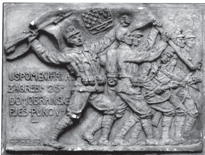
Slika 5. Reljef Uspomeni Hrvata

No, 25. pukovnija izričito se spominje na gipsanom reljefu pričvršćenom na drvenu podlogu koji se čuva u Hrvatskom povijesnom muzeju (HPM/MRNH S – 72, slika 5.). Motiv je vrlo sličan, ali taj se reljef razlikuje od prethodnoga po natpisu jer stoji: USPOMENI HRVAT. / ZAGREB – 25. / DOMOBRANSKE / PJEŠ. PUKOV., što je bilo dovoljno da se pozivanjem na istovjetnost motiva prethodni reljef pripiše toj pukovnici. 26 Ta klasifikacija u vojnom smislu nije posve neispravna jer je 25. pukovnija bila sastavni dio 42. domobranske divizije, ali ipak nije posve točna. 27 Naziv „Vražja divizija” rabio se za cijelu diviziju pa mislim da je vrlo vjerojatno da je prvotna medalja bila izrađena u čast cjelokupne postrojbe, a da je gipsani reljef prva faza izrade specijalističkih plaketa za njezine pojedine pukovnijske sastavnice – 25. zagrebačku, 26. karlovačku, 27. sisačku i 28. osječku pukovniku.