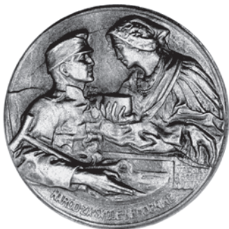
Slika 10. Značka Narod za svoje nemoćnike

Istovjetan motiv, samo u obliku značke, nalazi se u Hrvatskom povijesnom muzeju (HPM/PMH – 12621, slika 10.). Značka je promjera 28 mm i izrađena je od legure cinka. 42