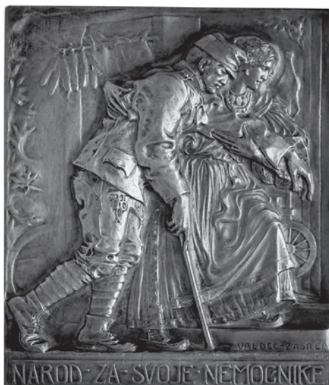
Slika 7. Plaketa Narod za svoje nemoćnike iz Moderne galerije, snimio: Goran Vranić

U Zbirci medalja i plaketa Moderne galerije čuva se još šest primjeraka te plakete izrađene od drugih kovina, a zanimljivo je da su sve različitih veličina. Tako je šuplje kovano bakreni primjerak velik 32,5 x 28,5 mm (MG 2892-504), pozlaćeno srebrni velik je 64,5 x 56 mm i teži 125 g (MG 2892-505), a brončani je primjerak velik 42 x 36 mm (MG 631). Od ratne kovine izrađena su dva jednako velika primjerka (66 x 57 mm): jedan je pobakreni šuplje kovani primjerak (MG 2892-506), a drugi je od „obične“ ratne kovine (MG 2892-507). Posljednji primjerak izrađen je od šuplje kovanoga tombaka i velik je 32,6 x 28,6 mm (MG 2892-1903). 39