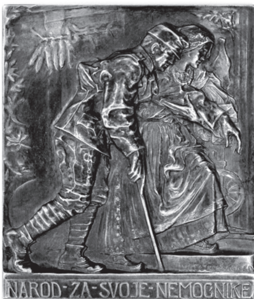
Slika 6. Plaketa Narod za svoje nemoćnike iz Hrvatskoga povijesnog muzeja

ga žena prevodi preko praga vlastitoga doma „da premda nemoćan ipak bude koristan član narodne cjeline”. Na drugom odljevu prikazan je „nemoćnik-vojnika” odlikovan kolajnom za hrabrost kako nemoćan sjedi u „bolesničkom stolcu”, a „Hrvatica-seljakinja, ta predstavnik obće narodne požrtvovnosti”, pruža mu okrepu. Banov posjet umjetniku bio je više od pukoga posjeta i članak zauzima gotovo cijeli novinski stupac. Ratna propaganda morala ga je iskoristiti za jačanje patriotizma pa opis plakete poetski završava rečenicom koju bi prikazana Hrvatica sigurno izgovorila da može. Rečenica glasi: „Hrvatski narod ne će zaboraviti svojih junaka, koji mu i dom i rod odbraniše od neprijatelja.” 37