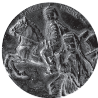
Slika 2. Medalja Barun Trenk

U Hrvatskom povijesnom muzeju čuva se jedan primjerak te medalje (HPM/PMH – 10476, slika 2.), koja se igrom slučaja ne nalazi u velikom katalogu predmeta iz Prvoga svjetskog rata. Jednostrana medalja promjera je 41 mm i iskovana je u bronci i patinirana. Na medalji je prikazan jahač na propetom konju kojega prate dva pješaka, a jedan od njih svira sviralu. Lik sa sviralom detaljno je obrađen, a drugome se vidi samo kukuljica na glavi. Lijevo i desno od centralnog lika piše BARUN TRENK, a lijevo dolje ispod konjskih kopita stoji potpis SPIEGLER.