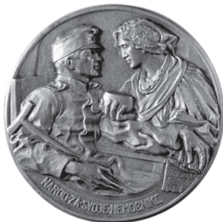
Slika 9. Medalja Narod za svoje nemoćnike , snimio: Goran Vranić

Drugi je motiv Narod za svoje nemoćnike do danas ostao sačuvan u obliku lijevane brončane jednostrane medalje i u obliku značke. Koliko mi je poznato, medalje s tim motivom sačuvane su jedino u Modernoj galeriji, i to tri primjerka različitih veličina. Najveća je promjera 78 mm (MG 2892-502, slika 9.), druga je promjera 77,5 mm (MG-638), a treća je promjera 38,1 mm (MG-630). 41 Prilično je sigurno da su ovisno o veličini imale i različitu prodajnu cijenu.