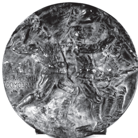
Slika 3. Reljef U spomen junačkih hrvatskih domobrana

se navodi da je reljef posvećen 25. zagrebačkoj domobranskoj pukovniji. 23 Međutim, to ne piše na samome predmetu, što se posve jasno vidi na slici 3.