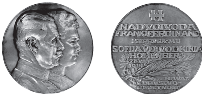
Slika 1. Medalja Smrt nadvojvode Franje Ferdinanda i supruge Sofije

vjerojatno u korist samoga društva. U vrijeme dok još nije bilo rata medalja se nije mogla prodavati u dobrotvorne svrhe pa se ovom prilikom neću njome približe baviti.