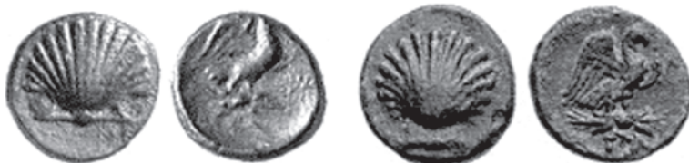
Biuncije iz grada Graxa

Prikaz školjki na kovanom novcu s juga Italije pripada najvjerojatnije u zadnje odjeke masovnoga prikaza školjki na numizmatičkom materijalu. Kao zorni primjer valja navesti neke primjerke kovane u Apuliji, poznatoj također pod imenom Messapia prema ilirskom entitetu (prema nekim autorima) koji je nastanjivao to područje. Tipični je primjer novac grada Graxa, biuncije s orlom na reversu te školjkom Sv. Jakova na reversu. Zanimljivo je da na današnjem području toga grada nije pronađena ni jedna od tih kovanica; sve su nađene u središnjoj Italiji.