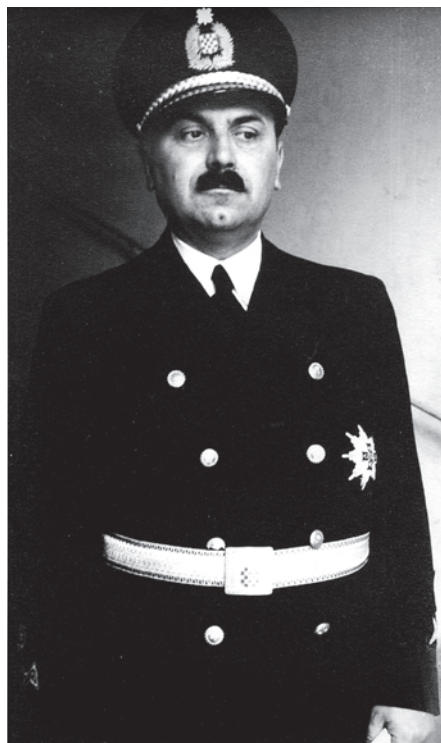
Slika 5. Ministar u vladi NDH Stjepan Hefer u svečanoj uniformi sa zvijezdom pri dodjeli Velereda za zasluge, osobna fotografija odlikovanoga.