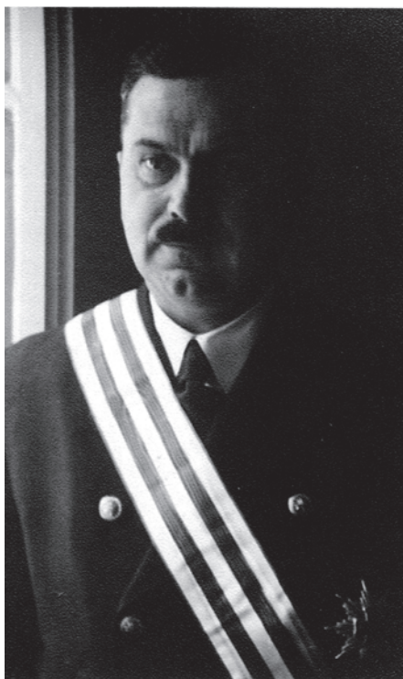
Slika 4. Ministar u vladi NDH Stjepan Hefer pri dodjeli Velereda za zasluge. Slika s lentom i zvijezdom, osobna fotografija odlikovanoga.

vali su uglavnom ministri u vladi (slike 4., 5.) i najviši crkveni velikodostojnici (npr. nadbiskup A. Stepinac). Najzaslužniji građani i vjerski dužnosnici dobivali su I. stupanj sa zvijezdom, I. stupanj te niža odlikovanja Reda za zasluge. Podatci iz Brojtitbenog izkaza - redova odlikovanja znatno su pridonijeli spoznaji o tome koliko je zapravo dodijeljeno odlikovanja NDH te kakva je bila „politika“ dodjele odlikovanja u NDH prema vlastitim građanima i prema stranim državljanima, osobito Nijemcima.