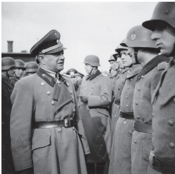
Slika 2. General Matija Čanić, nositelj I. stupnja krune kralja Zvonimira sa zvijezdom. Zapovjednik kopnenih snaga NDH.