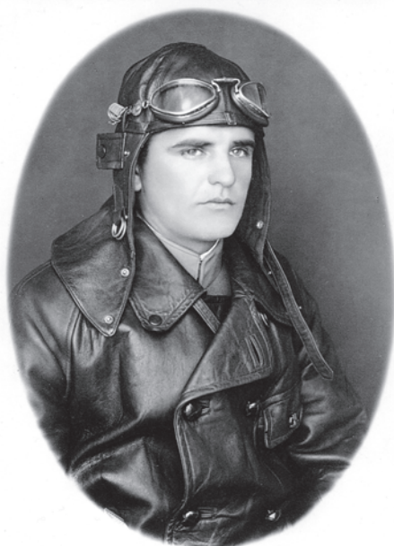
Slika 3. Cvitan Galić, posmrtno odlikovan Zlatnom kolajnom poglavnika Ante Pavelića, heroj hrvatskoga ratnoga zrakoplovstva. Ovo je osobna fotografija Galića koju je s posvetom darovao prijatelju.