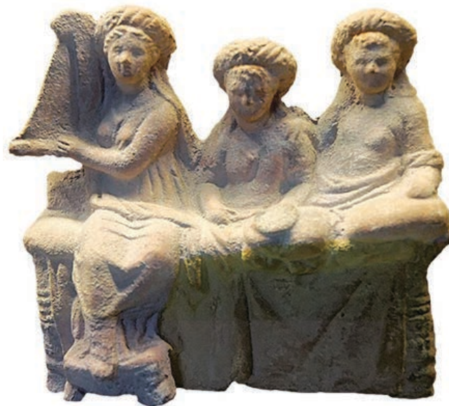
Prikaz hetera u antičkoj Grčkoj

podrijetla (4). Njihovo su društvo tražili najugledniji ljudi. Na glasu su bile hetere: Aspazija, poslije Periklova žena; Frina, Praksitelova ljubavnica i model za njegov kip Afroditice; Glikera, ljubavnica komediografa Menandra; Taida, miljenica Aleksandra III. Velikoga; Laida, s kojom su se družili filozofi Diogen iz Sinope i Aristip iz Kirene (3). U grčkoj književnosti opisali su ih Lukijan ( Razgovori hetera ) i Alkifron ( Pisma hetera ), a u modernoj P. Louÿs u zbirci Bilitidine pjesme (Les Chansons de Bilitis) . Hetera su postojale i uz hramove, npr. uz Afroditin hram u Korintu (4).