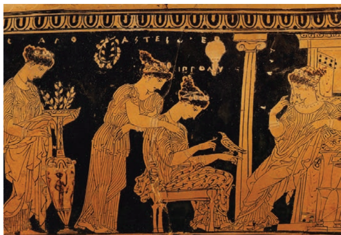
Prikaz žena u antičkoj Grčkoj

obiteljsku vezu jer osim osoba podrazumijeva dom, kuću, imanje, vlasništvo, domaćinstvo i cijelo gospodarstvo kao osnovu življenja i daljnjeg stvaranja (Erent - Sunko, 2007: 606). Prevlad muškarca smatrala se osnovnom činjenicom u odnosu između spolova u cjelokupnom povijesnom razvoju, a ne samo u Ateni, pa se takva činjenica ne može uzeti kao specifičnost ni atenskog društva ni starog vijeka. Vlast muškaraca nad ženama određena je, po Aristotelu, njihovom prirodom jer je "muško po naravi sposobnije vladati od ženskog" (Erent-Sunko, 2007: 608). Aristotel zamjera Spartancima što je njihov zakonodavac, zaboravljajući da je grad-država kao i dom podijeljen na dvoje (žene i muškarce), žene posve zapostavio, odnosno dao im preveliku slobodu ostavljajući ih da žive razuzdano. Takvo je mišljenje on stekao ne samo zbog načina njihova odijevanja, koje je bilo drugačije od atenskog, već i zbog načina života. Kada su se i Atenjanke počele odijevati slobodnije, što se možda dogodilo po uzoru na Spartanke, osnovana je posebna služba za nadzor nad njima – ginaikonom (Erent-Sunko, 2007: 608-609).