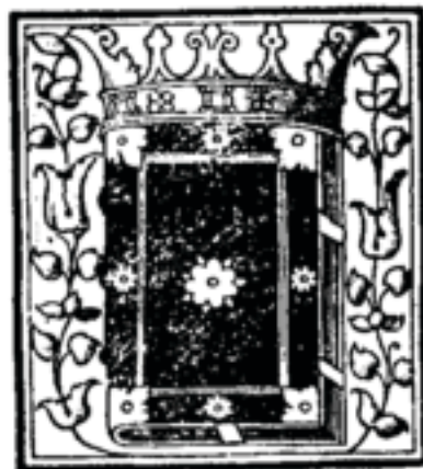
Naslovnica prvog izdanja Judite

Prodaiuse ubnecih umarcarij uftacū chidarfi libar fa lignao.